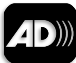
Slika 5.1 logotip za audio vodiče (Audio Described Media)

Logotip za verbalni opis opisan je velikim slovima AD s tri zvučna vala koja izlaze iz slova D (slika 5.1).