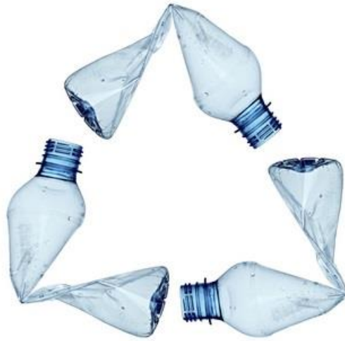
Slika 2.4 Primjer povratne ambalaže

vraća proizvođaču koji je nakon čišćenja i pranja ponovo upotrebljava za pakiranje. Uz transportnu ambalažu, koja je uglavnom povratna (bačve, cisterne, sanduci...), u ovu kategoriju spadaju i neke vrste prodajne ambalaže (npr. boce za komprimirane plinove, staklene boce). Nepovratna ambalaža upotrebljava se za jednokratno pakiranje. Najveći dio prodajne ambalaže je nepovratan iz praktičnih i ekonomskih razloga. Nakon što kupac upotrijebi sadržaj ona predstavlja otpad. Velike količine nepovratne prodajne ambalaže postale su ekološki problem. Stoga se danas različitim mjerama potiču proizvođači da proizvode ambalažu koju je moguće ponovo upotrijebiti ili reciklirati, odnosno da upotrebljavaju biorazgradive ambalažne materijale kako bi se nepovoljni utjecaj na okoliš smanjio na najmanju moguću mjeru.[2]