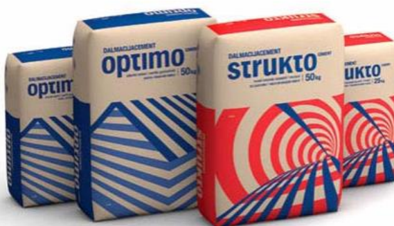
Slika 2.1 Primjer primarne ambalaže, vreća za pakiranje cementa