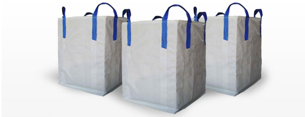
Slika 3.1 Volumiozne vreće