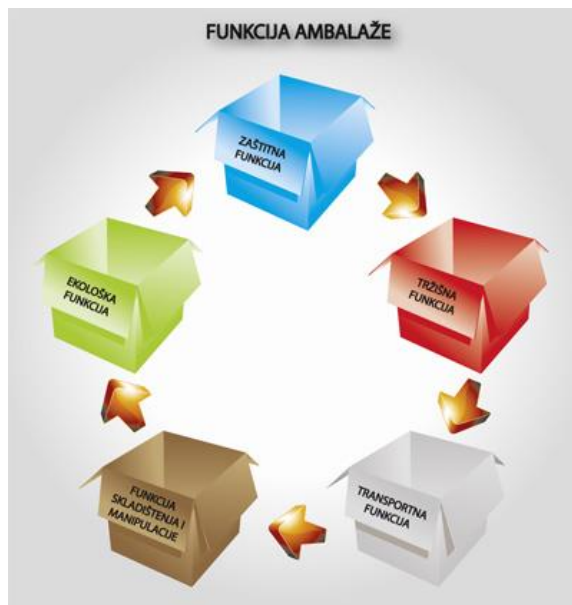
Slika 2.3 Funkcija ambalaže

Od glavnih elemenata ambalaže očekuje se da štiti sam proizvod i da je jednostavna za rukovati. Iako dizajn ambalaže nije među važnijim elementima ambalaže, on ima veliki utjecaj na samu prodaju proizvoda, jer će velika većina potrošača kupiti proizvod na temelju izgleda, odnosno dizajna.