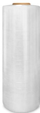
Slika 3.5 Strojna stretch folija

Koriste se za strojno ovijanje robe različitih vrsta i dimenzija u svim industrijskim granama. Strojna stretch folija stavlja se u stroj koji ima okretnu platformu na kojoj se nalazi paleta s robom. Okretna platforma okreće paletu s robom i pritom nateže foliju koja se ovija oko palete (stroj sam ovija paletu). Natezanjem folije postižu se znatne uštede u potrošnji stretcha.