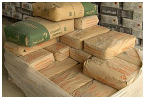
Slika 2.2 Primjer sekundarne ambalaže, paleta sa vrećama cementa omotana folijom