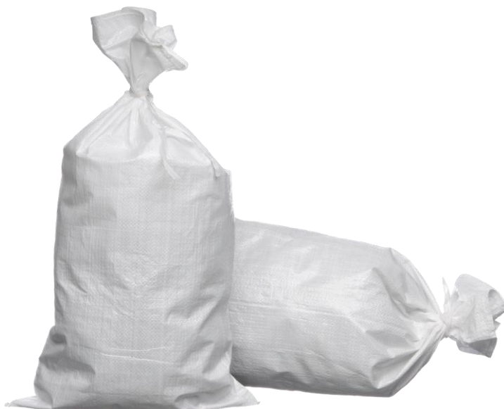
Slika 3.2 Polipropilenske vreće