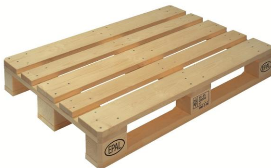
Slika 3.3 Euro paleta

Dimenzija EUR-paleta je 120 cm x 80 cm x 14,4 cm, a težina iznosi 20-24 kg. Nosivost palete iznosi 1500 kg.