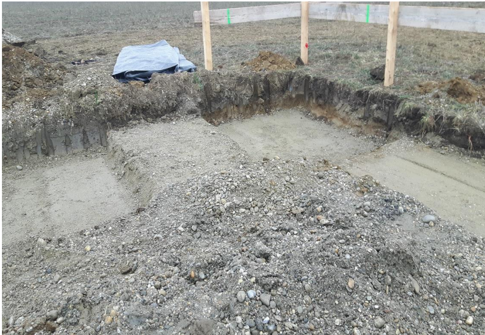
Slika 4. Strojni iskop jame za temeljne stope