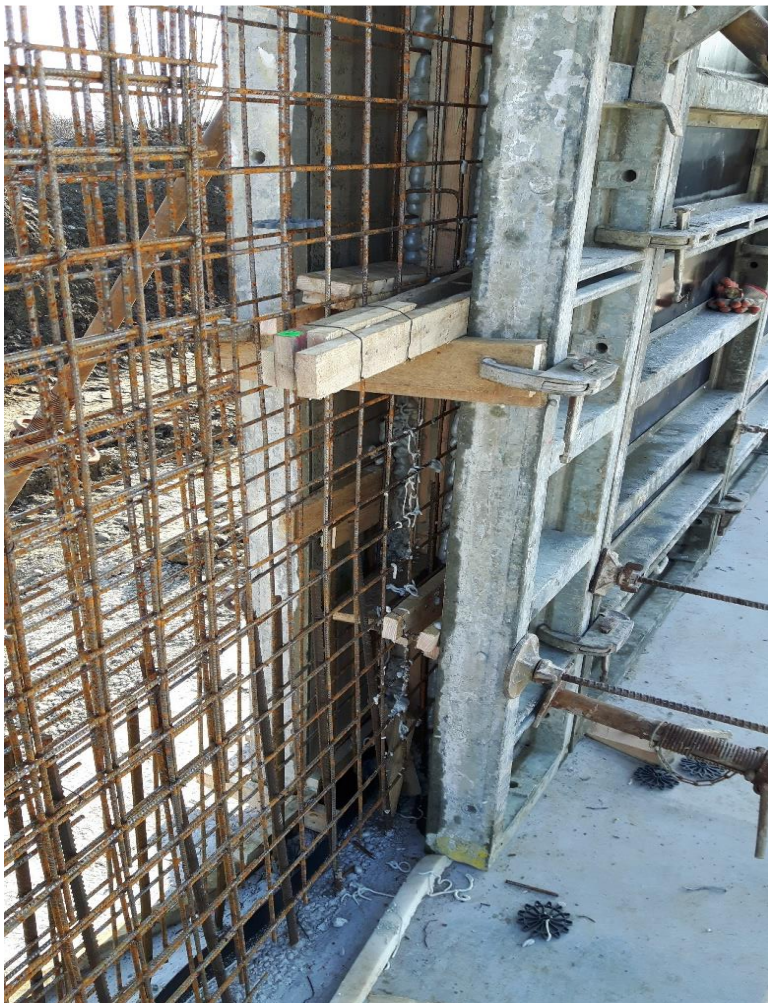
Slika 11. oplata armaturnih zidova