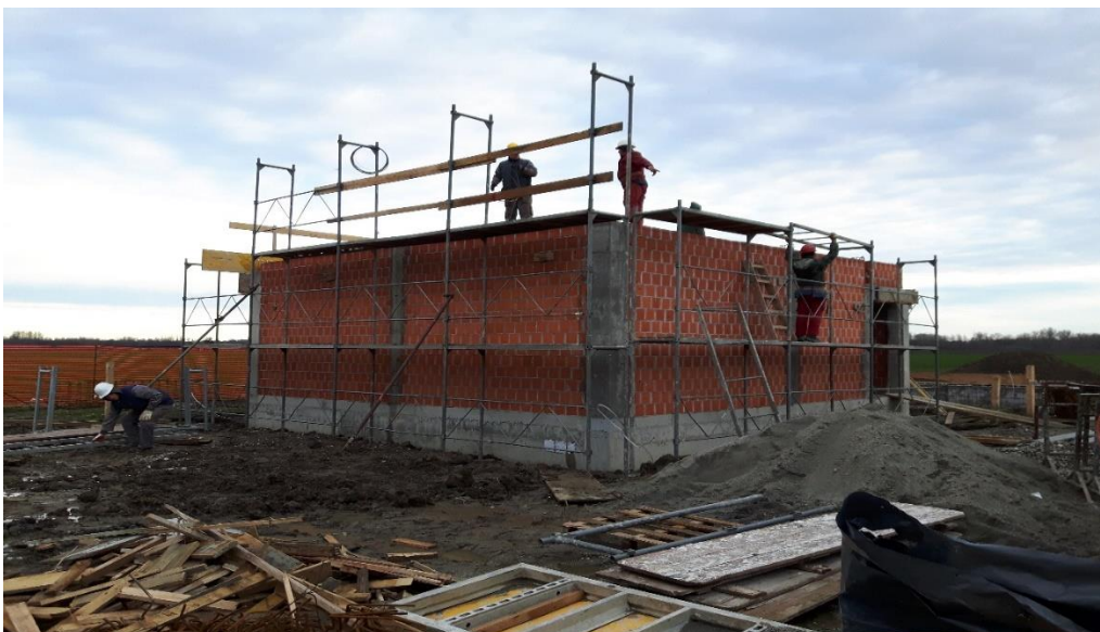
Slika 8. zidanje energetske građevine- trafostanice

Jedinična cijena sadrži sav potreban materijal, rad i potrebne skele radne platforme, pogonsku energiju, sve horizontalne i vertikalne transporte, sva sredstva zaštite pri radu radnika na gradilištu i druge režijske troškove. U jediničnoj cijeni žbukanja potrebno je obuhvatiti sav potreban rad i materijal. Žbuka se obračunava po m^2 stvarno izvedene površine s odbitkom svih otvora gdje nema špaleta. Ako ima špaleta, obračun se vrši prema važećim građevinskim normama. Žbukanje zidova i stropova može se izvoditi tek pošto se utvrdi da su zidovi i stropovi izvedeni u skladu s tehničkim mjerama i propisima koji su propisani. Građevinski metalni dijelovi ugrađuju se cementnim mortom. Prije ponude izvođač radova mora zatražiti sva potrebna razjašnjenja od projektanta ako neke stavke u troškovniku nisu dovoljno opisane jer se kasnije prigovori neće uzeti u obzir [2]. Na slici 8. vidljivo je zidanje energetske građevine, odnosno trafostanice.