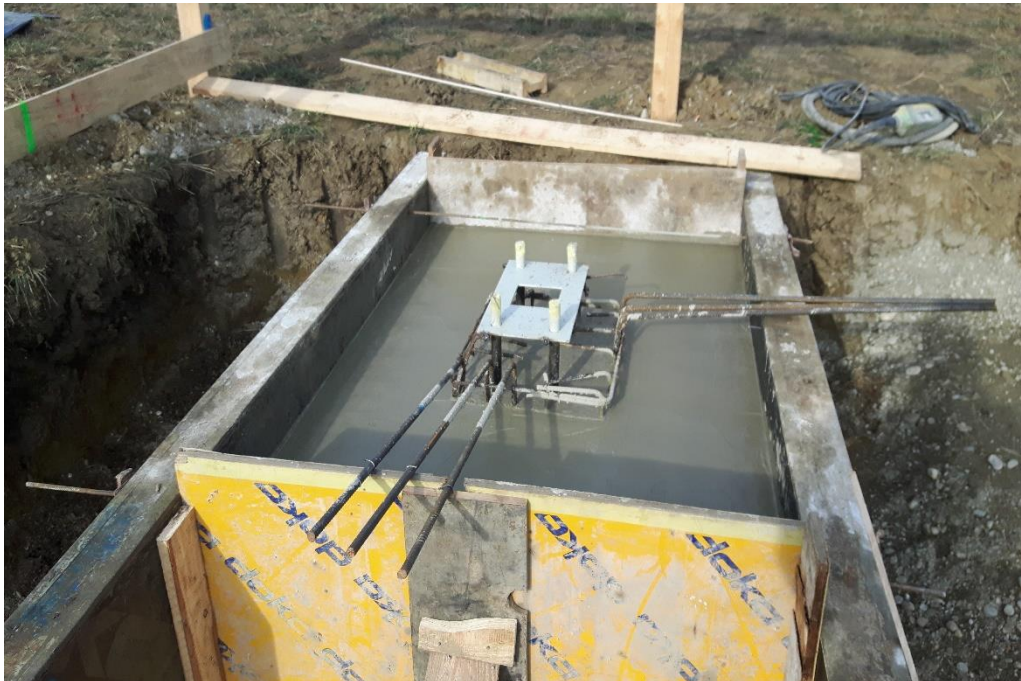
Slika 6. Betoniranje temeljne stope

Svi armiranobetonski elementi izvode se u glatkoj oplati kojoj treba posvetiti posebnu pažnju, te se sva naknadna štemanja, brušenja i popravci neće posebno obračunavati. Stupovi i zidovi ne presijecaju se hidroizolacijom, nego se izvodi sloj vodonepropusnog betona u visini od 80 cm iznad kote hidroizolacije. Izvođač radova je dužan prije početka izvođenja osigurati Projekt betona u skladu sa važećim čl. 232 Pravilnika o tehničkim normativima za beton i armirani beton i isti dati na ovjeru investitoru, te po istome vršiti potrebne kontrole. Ukoliko se ne izradi i ukoliko se investitor ne suglasi s ovim projektom nadzor će zabraniti početak izvođenja betonskih radova [2]. Na slici 6. prikazano je betoniranje temeljne stope, dok slika 7. prikazuje betoniranje AB podne ploče postdigestora.