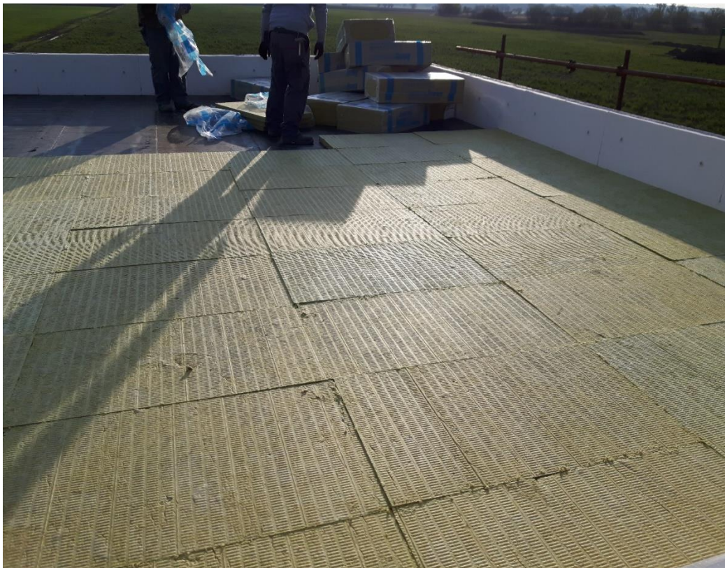
Slika 12. Postavljanje toplinske izolacije

Slika 9. Prikazuje postavljanje toplinske izolacije, dok je na slici 10. vidljivo postavljanje vertikalne hidroizolacije na digestor.