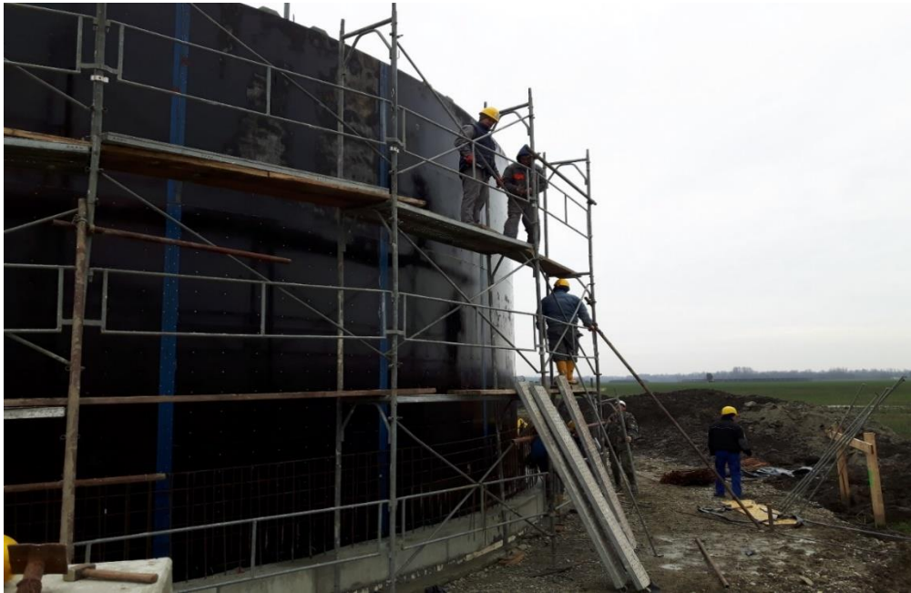
Slika 13. Postavljanje vertikalne hidroizolacije na digestor