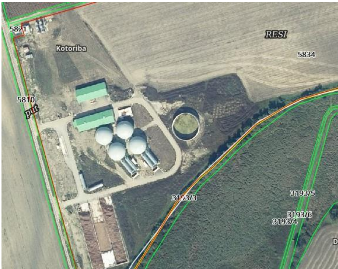
Slika 2. Prikaz parcele

Bioplinsko postrojenje nalazi se na novoformiranoj građevnoj čestici u Kotoribi. Na slici 2. [3] prikaz je spomenute katastarske čestice. Površina katastarske čestice br. 5834 k.o. Kotoriba na kojoj je planirana gradnja predmetnog kompleksa građevina iznosi 213.753,00 m 2 . Teren građevne čestice je pretežito ravan, a sama čestica je nepravilnog tlocrtnog oblika. Kolni i pješачki pristup na predmetnu građevnu česticu osiguran je sa zapadne te sjeverne strane, a unutar građevne čestice bit će moguć kružni tok prometa. Građevna čestica će se u prvoj fazi koja je obuhvaćena ovim projektom sa sjeverne, južne i zapadne strane ograditi prozračnom žičanom ogradom visine 1,80 m mjereno od visine terena, a s istočne strane čestice izvest će se ograda visine 1,50 m. Kolna vrata će se izvesti kao konzolna klizna vrata pokretana elektromotorom ili ručno. Visina kolnih vratiju bit će jednaka visini ograde. Dispozicija buduće građevine i susjednih građevina te prilaz na parcelu i uređenje prikazani su u grafičkom prilogu situacija.