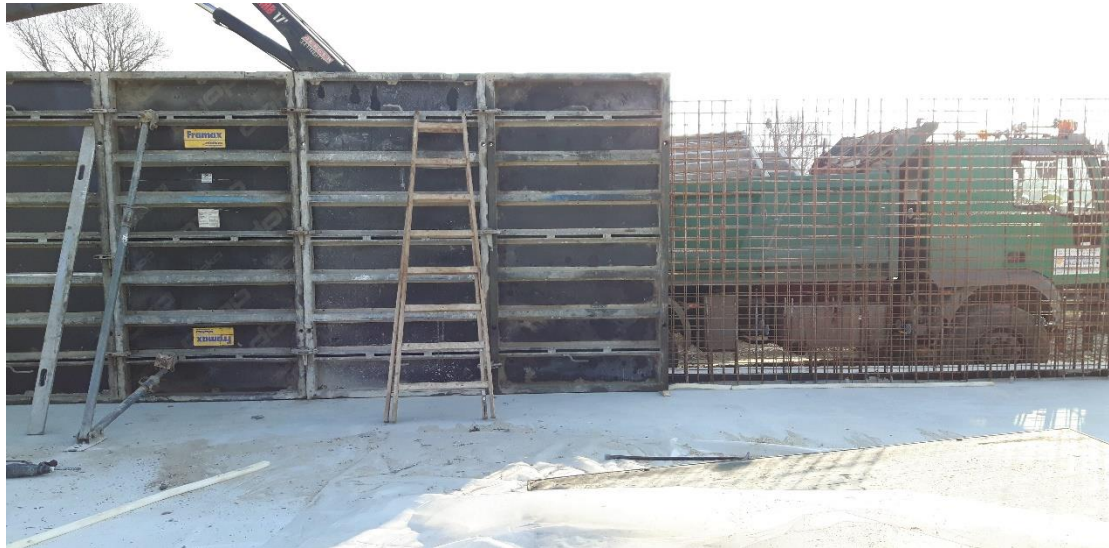
Slika 10. Postavljanje oplata za vertikalne armaturne zidove