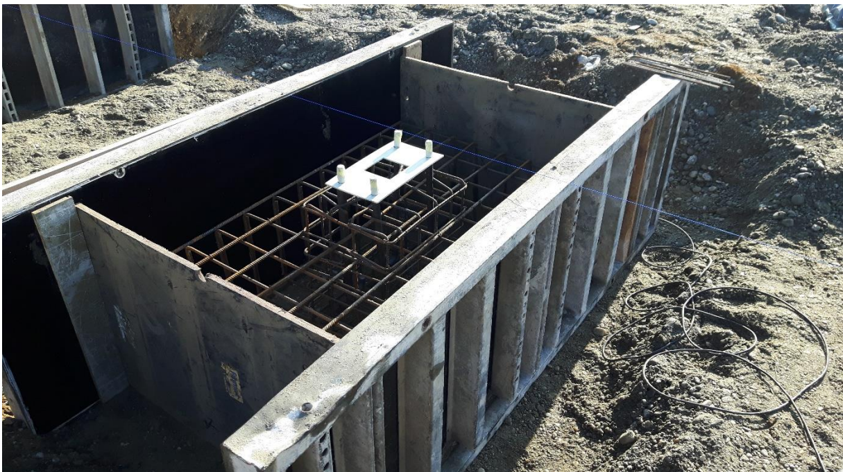
Slika 9. Oplata za temeljne stope

Oplata i skele trebale bi biti stručno izvedene. S obzirom na upotrebu vibracijskog uređaja za ugrađivanje moraju biti dovoljno čvrste i stabilne da omoguće ugrađivanje bez promjene oblika i propuštanja cementnog mlijeka na nastavcima. Naknadni radovi na obradi površine zidova (brušenje, krpanje i sl.) koji su izazvani nepravilnošću oplata izvest će se na račun izvoditelja radova. Za izvođenje tipskih etaža preporuča se upotreba tunelske oplata. Nekoliko sati prije početka betoniranja oplata mora biti obilno polijevana. Glatku i čeličnu oplatu treba premazati odgovarajućim premazima. Na slikama 9., 10. i 11. [2] prikazane su izvedene oplata vertikalnih zidova digestora i postdigestora te oplata za temeljne stope. Ugrađivanje betona treba se izvršavati isključivo vibracijskim uređajima. Betonske konstrukcije betonirane na mjestu treba ugrađivati pervibracijskim iglama odgovarajućeg promjera i dovoljnim brojem oplatnih vibratora. Visina frekvencije upotrijebljenih uređaja i vrijeme vibriranja treba biti usklađeno sa karakteristikama ugradljivosti pojedinog betona. Betoniranje podloge poda treba izvesti s dovoljno energičnim plutajućim vibratorima. Način i potrebno vrijeme njegovanja, kao i vrijeme skidanja oplata i skele, treba odrediti suglasno s nadzornim inženjerom, a u ovisnosti o konstrukciji, atmosferskim prilikama i vrsti betona [2].