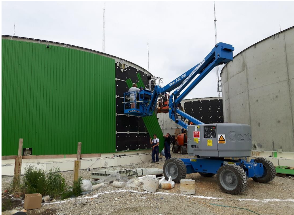
Slika 14. Stavljanje lima na digestor i postdigestor