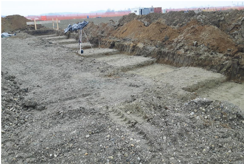
Slika 5. Strojni iskop jame za temeljne stope