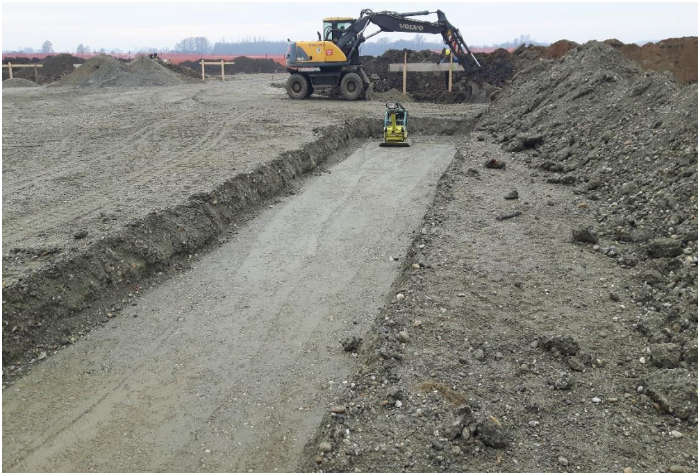
Slika 3. Strojni iskop jame

Zbog moguće pojave većih kaverni u grebenima vapnenačkih pješčenjaka i vapnenačkog lapora, potrebno je nakon završetka iskopa izvesti provjeru kompresorskim bušenjem štapom promjera 32 mm do dubine 200 cm od kote dna temelja na poziciji koncentriranih opterećenja. Prilikom širokog iskopa za temelje potrebno je obratiti pozornost na stabilnost iskopa (pokosa) mogućih odrona tla – stijenske mase i ugrožavanja postojećih građevina i prometnica. Prilikom planiranja organiziranja izvođenja zemljanih radova voditi računa o mogućnosti pristupa, odnosno proučiti tehničku dokumentaciju koja tretira ovu materiju [2]. Na slici 3. prikazan je strojni iskop jame, a na slikama 4. i 5. strojni iskop jame za temeljne stope.