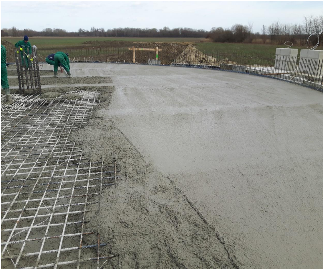
Slika 7. Betoniranje AB podne ploče postdigestora