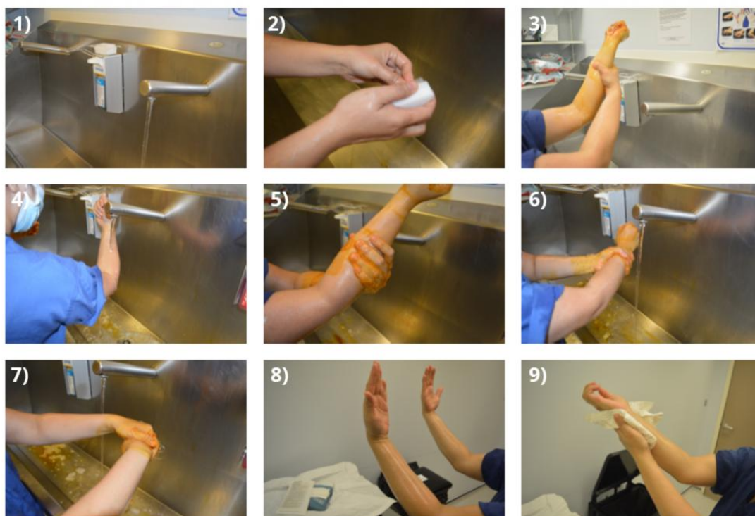
Slika 5.6.1.1. Postupak prijeoperacijske antiseptike ruku/podlaktica [38]