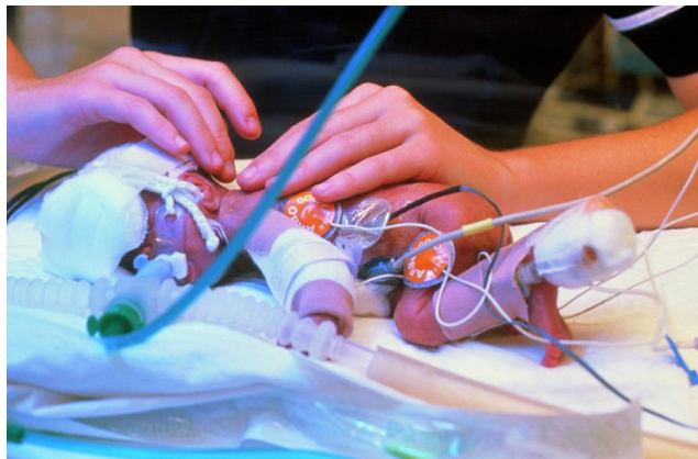
Slika 9.2. Nedonošče sa senzorima i tubusom