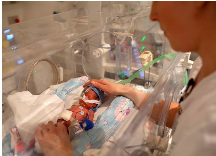
Slika 9.1 Nedonošče u inkubatoru