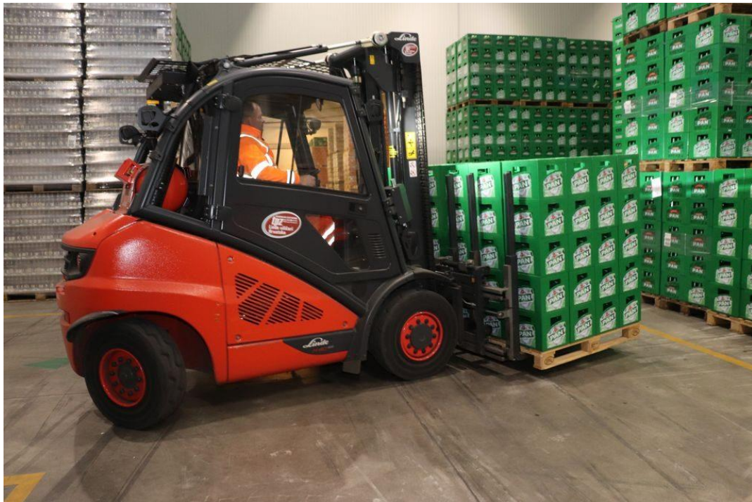
Slika 9 Skladišni viličar