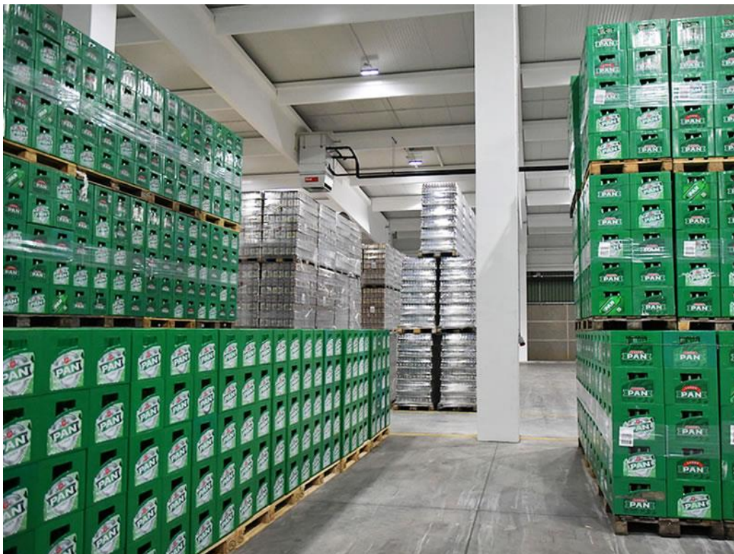
Slika 8 Skladište pivovare Carlsberg Croatia d.o.o.