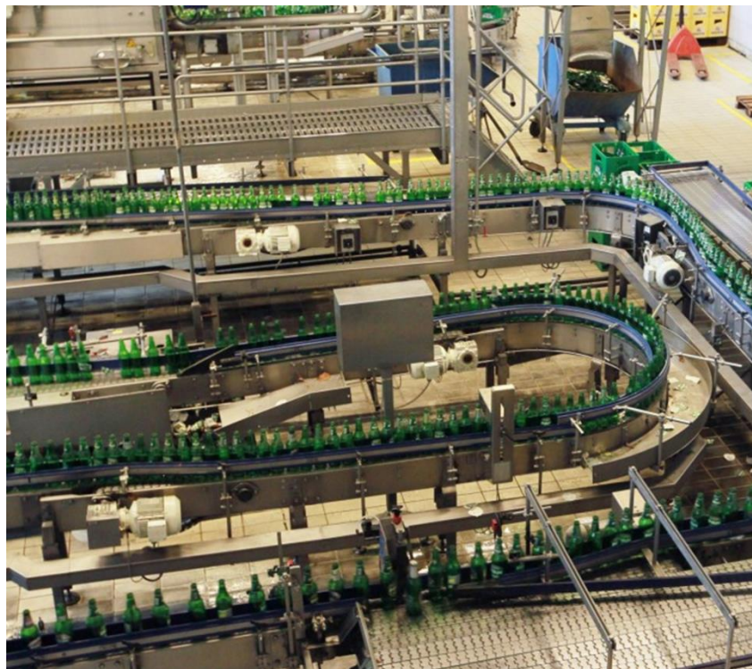
Slika 12 Proizvodnja pive