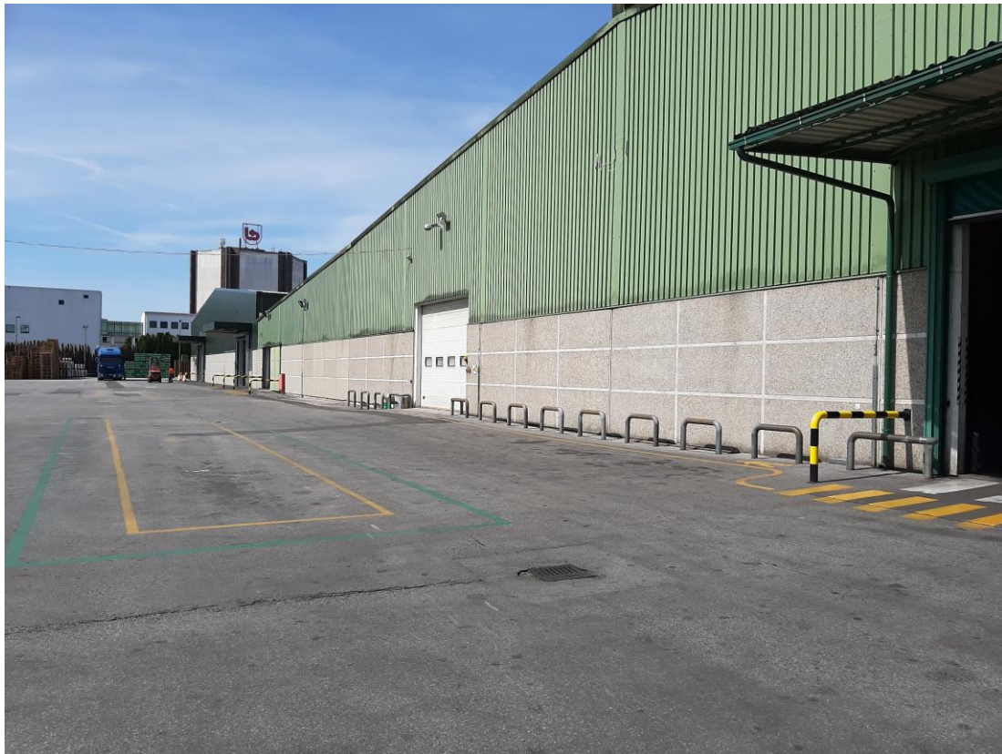
Slika 11 Ulaz skladišta za utovar robe