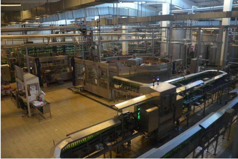
Slika 13 Proizvodni dio pivovare