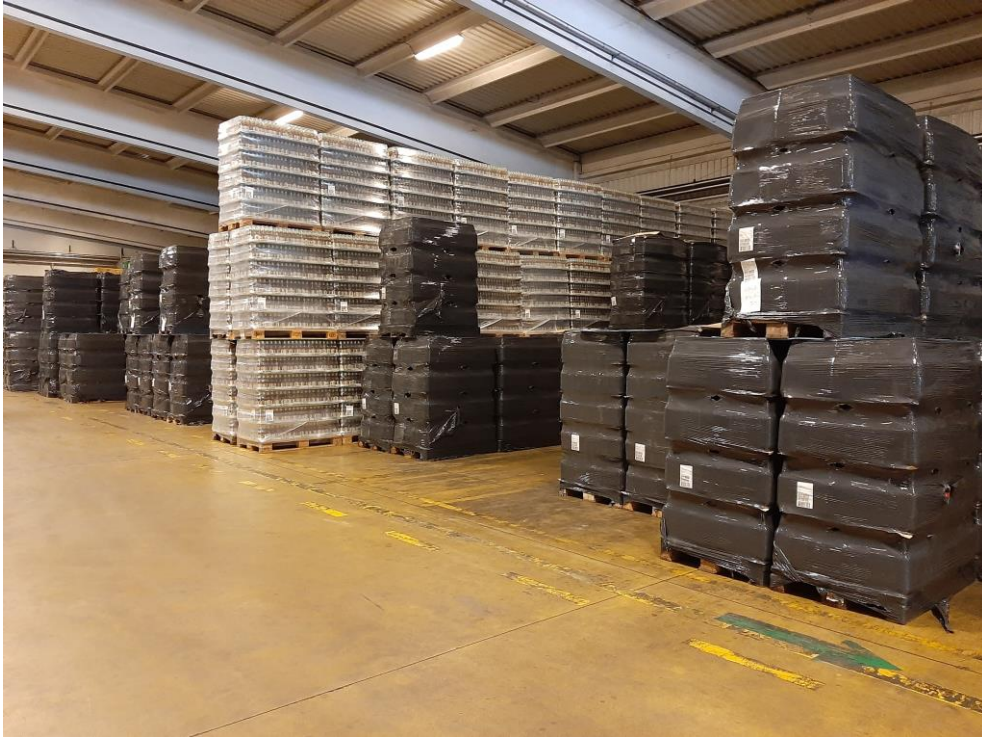
Slika 5 Skladište pivovare Carlsberg Croatia d.o.o.