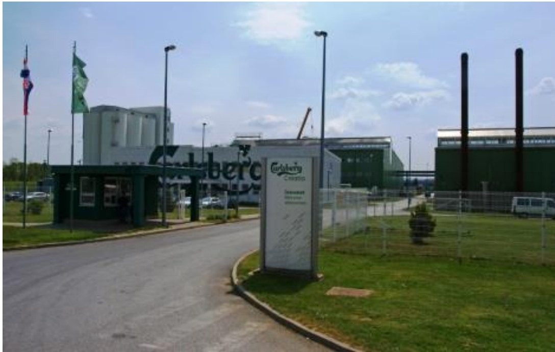
Slika 3 Ulaz u pivovaru Carlsberg Croatia d.o.o.