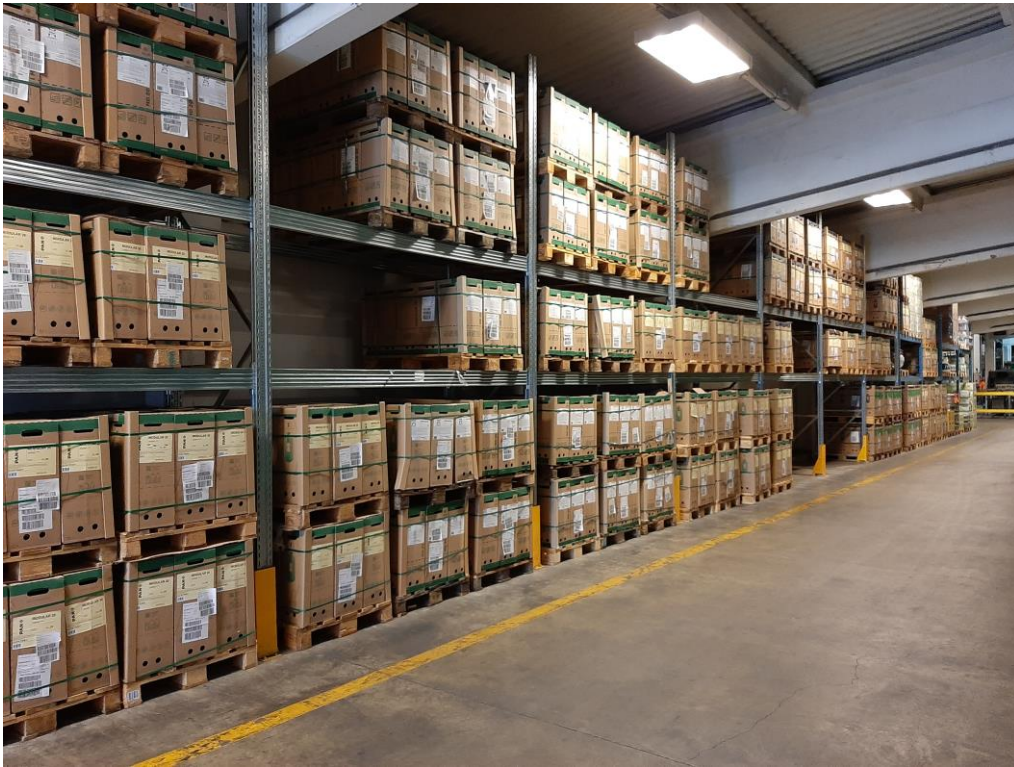
Slika 7 Skladište pivovare Carlsberg Croatia d.o.o.