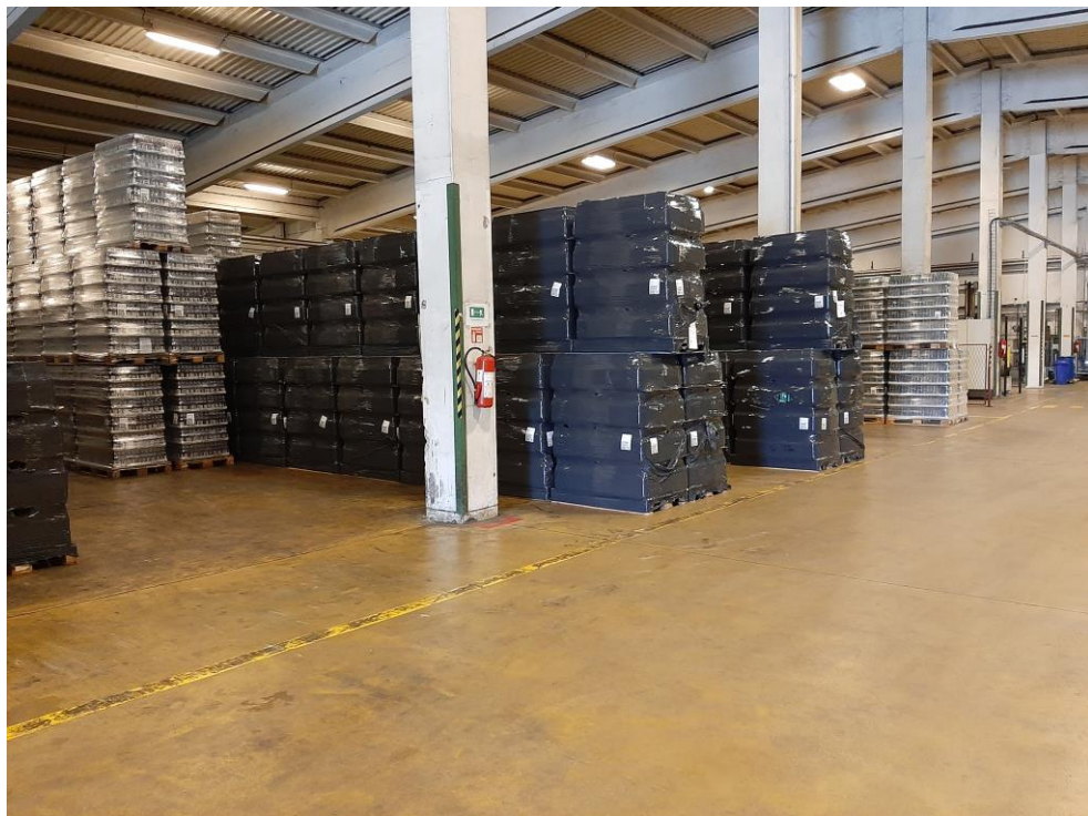
Slika 6 Skladište pivovare Carlsberg Croatia d.o.o.