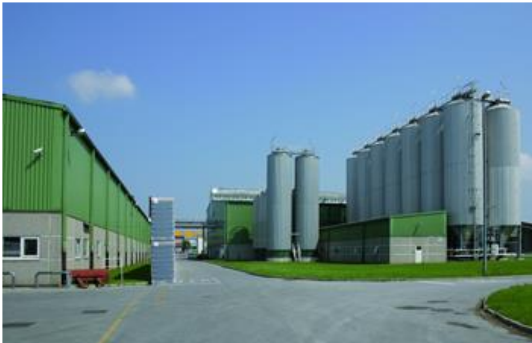
Slika 4 Postrojenje pivovare Carlsberg Croatia d.o.o.