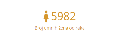
Slika 2.2.4.1 Incidencija raka u Hrvatskoj za 2015.godinu