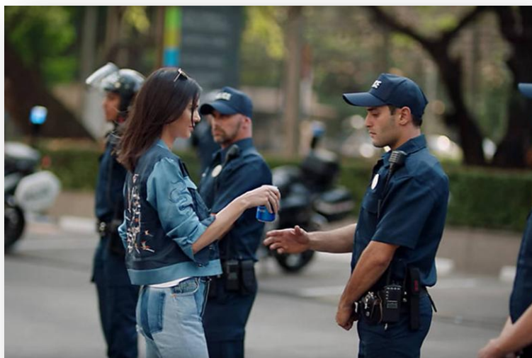
Slika 3.5. Kontroverzna Pepsi reklama s Kendall Jenner