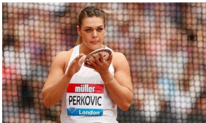
Slika 5.1.2.1. Hrvatska atletičarka, Sandra Perković

Baš kao i Ademi, Sandra Perković nije bila svjesna da kroz energetske napitke unosi zabranjenu supstancu u tijelo te je to i priznala na saslušanju. Zbog priznanja i surađivanja dobila je manju kaznu nakon koje je apsolutno pokorila svijet. Iako je propustila nadolazeće svjetsko prvenstvo na kojemu je trebala biti favorit za zlato, osvojila je zlato na Europskom prvenstvu i Olimpijskim igrama sljedeće godine. 2013. godine uz Mediteranske igre osvaja konačno i svjetsko zlato, a nakon toga osvaja zlato na još tri europska prvenstva, brani svjetsko zlato i zlato s Mediteranskih igara te s Olimpijskih igara donosi prvo srebro, a potom i novo zlato.