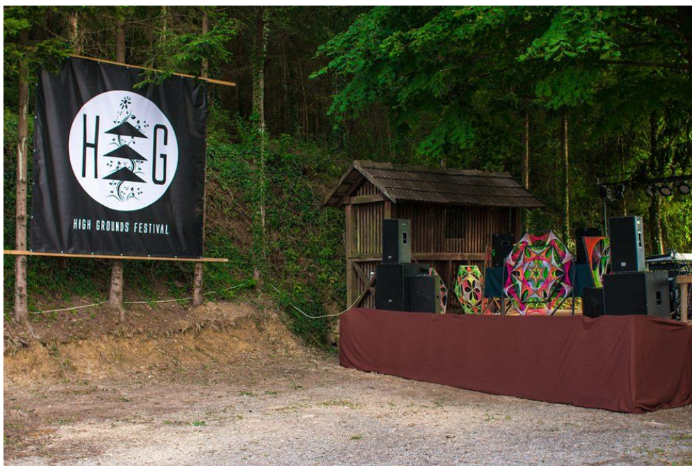
Slika 5.2.1 Jedna od pozornica

High Grounds je poznat po samoodrživoj zajednici, zdravoj i domaćoj hrani, filmovima koji educiraju, duhovnim predavanjima i izložbama, te trance glazbi koja je ujedno i drugi val hipi faze. Godina 2019. bila je prekretnica za taj festival zbog dosad najkvalitetnijih sadržaja. Na velikoj izložbi čak 14 studenata Sveučilišta Sjever izložit će radove o temi „Connecting with the Source“. Sve to u dva ljetna čarobna dana u hladovini šuma Varaždinskih Toplica. To je nešto neobično i posjetiteljima zanimljivo, sa svakog stajališta isplativo. Ljetni događaj koji ne stvara nikakve kulturološke probleme i nesuglasice.