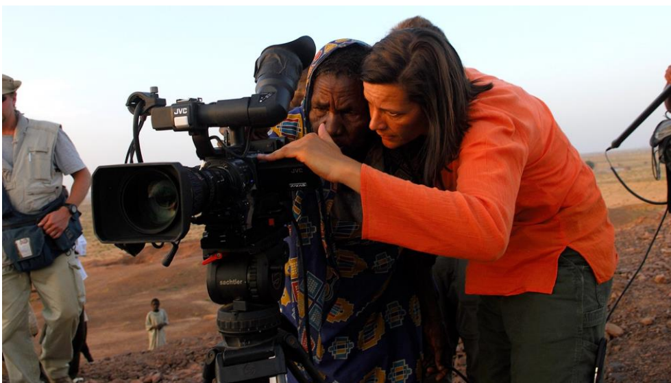
Slika 3.3.1 Novinar danas

Kada su kreiranje medijskog sadržaja preuzeli konzumenti, izgubio se trag onoga što je bitno. Svake sekunde bombardirani smo golemom količinom medijskih informacija u kojoj se čovjek lako izgubi, ne zna i ne može shvatiti što jest istinito i bitno, a što nije. „Novinarsko zagovaranje putem dokumentarnih filmova samo je jedna od opcija koja je dostupna pojedinim novinarima i filmašima koji još uvijek strastveno vjeruju u stvaranje svijeta boljim mjestom.“ (Charles 2013: 390)