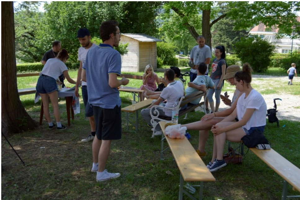
Slika 5.1 Udruga „Put prirode“ poslije organizirane šetnje

„Put prirode“ neprofitna je udruga mladih iz Varaždinskih Toplica koja svojim drukčijim pogledima na život pruža društvu informacije o prirodnom aspektu življenja. Kako priroda funkcionira, koji su to fenomeni našeg planeta pa sve do psiholoških prirodnih metoda kojima se čuva zdravlje – sve su to područja kojima se bavi „Put prirode“. Različitim radionicama, predavanjima, šetnjicama, izletima i svakojakim drugim sadržajima, volonteri iz Puta prirode kreiraju i omogućuju alternativne sadržaje u Varaždinskim Toplicama. Jedan od zanimljivih projekata udruge jest otvorena knjižnica, smještena u gornjem dijelu Toplica, za koju ne morate platiti članarinu. Usto što je to posebna ideja koju ne vidamo često u gradovima Varaždinske županije, izvrstan je način za uživanje u pisanoj umjetnosti. Potiče na više čitanja u svakidašnjim životima. Također, poznata kestenijada početkom jeseni svake godine privlači sve više Topličanaca na druženje uz vatru i pečene kestene, na otvorenome u srcu grada. Kako to biva, narod je sam sebi potreban za aktivno funkcioniranje društva. Mogućnosti je mnogo, bitno je da se pojedinci udruže i kreiraju organizaciju kojom će djelovati. Tako su i mlade nade Toplica osnovale udrugu koja se trudi poticati prirodni tijek naših života.