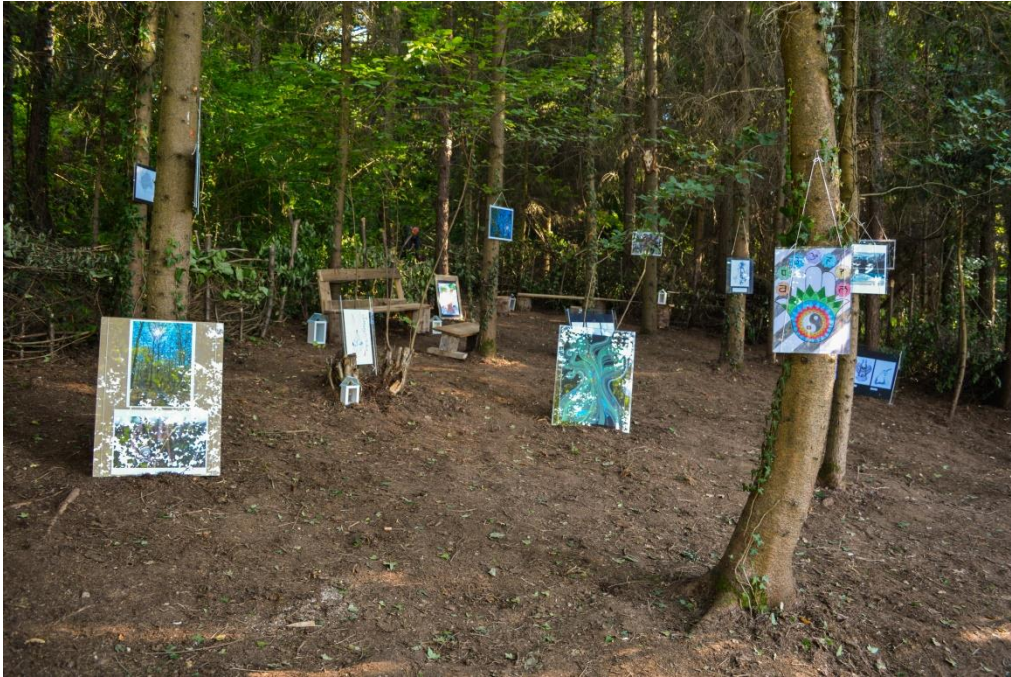
Slika 5.3.1 Dio izložbe na drugom izdanju festivala HG

Cijela izložba zamišljena je kao šetnja šumom kroz koju će publiku voditi zvukovi i svjetlost. Uz multimedijske radove, fotografije, crteže i ilustracije, studentice dizajna Lea Zrinščak i Lucija Glavina osmislile su instalacije koje će ujedno biti i dekoracije na festivalu. Stoga, velika izložba u šumi popraćena različitim audio-vizualnim kreacijama, upotpunit će posjetiteljima festivalski ugođaj na jednoj mističnoj i jedinstvenoj razini.