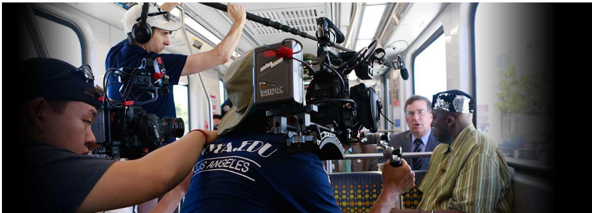
Slika 3.1 Snimanje

Participirajući mediji omogućavaju da korisnik u bilo kojem trenutku da svoj feedback svijetu. Prije je komunikacijski model funkcionirao na bazi jedan prema jednome. Danas je na bazi – svi prema svima. Blogovi i online chatovi početkom 21. stoljeća idealan su primjer multimedijiskoga komuniciranja. Pomoću teksta te audio i video animacija ljudima je omogućeno komuniciranje na sve ljudske podražaje. Sve je to donio spoj interneta i multimedije.