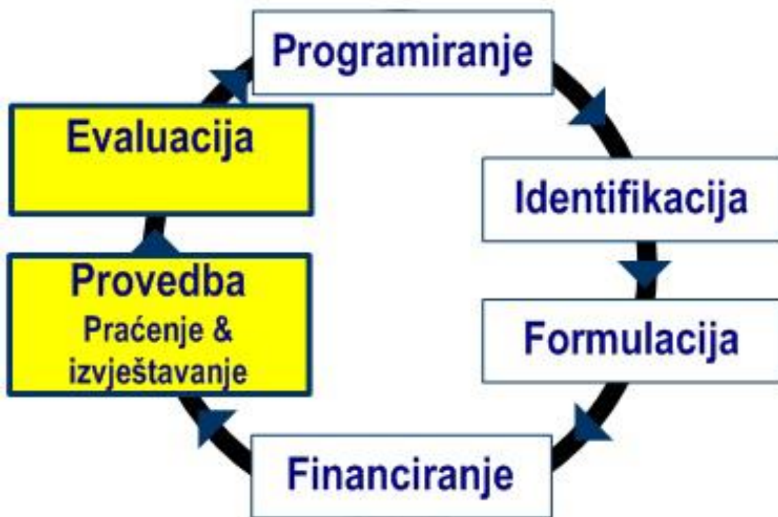
Slika 6.3.1 Provedba projekta