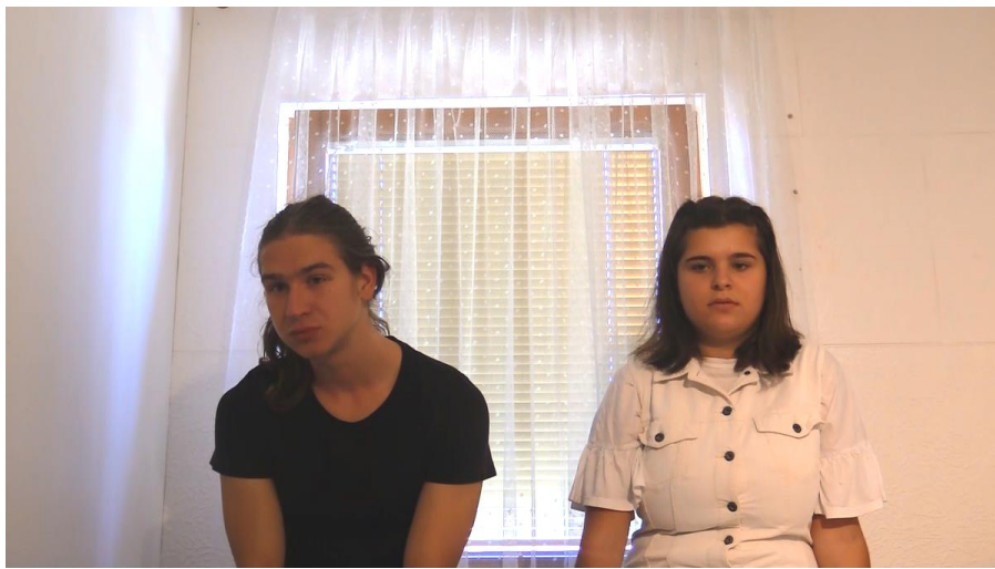
Slike 5.1 i 5.2 Prizori iz filma Nezamjenjiva

Svi prizori interakcije između Predraga, Simone i Jane kad prvo dvoje sjedi na stolu slično su kadrirani.