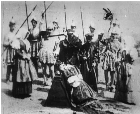
Slika 1.2 Prizor iz filma The Execution of Mary, Queen of Scots

Praktični dio rada sastojat će se od korištenja svog prikupljenog znanja i iskustva kako bi se sastavio scenarij i prema njemu snimio kratkometražni film u kojem će se više stanja svijesti glavnog lika personificirati i imati interakciju sa stvarnim (filmskim) svijetom.