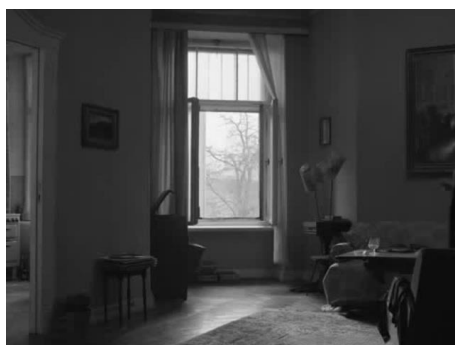
Slika 3.2 Kadar iz filma Ida

Ne osobito dugog trajanja s nešto manje od pola minute, ovaj primjer ukazuje na emocionalni utjecaj te na gradnju neizvjesnosti.