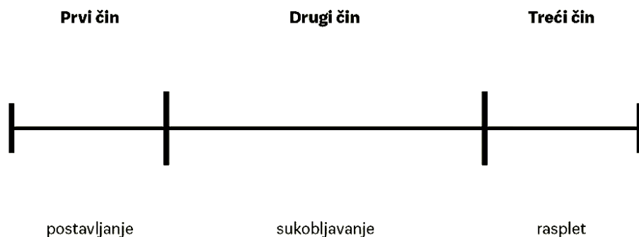
Slika 2.1 Princip tročinske strukture (gore) i slika 2.2 Junakov put Josepha Campbella (dolje)

Ovaj rad stavlja veći naglasak na alternativne načine strukturiranja koji su opširnije opisani u nastavku.