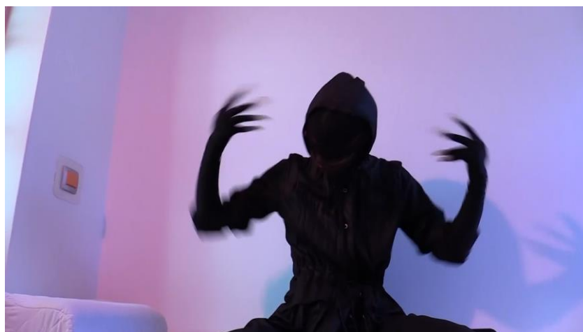
Slike 5.3 i 5.4 Prizori iz filma Nezamjenjiva