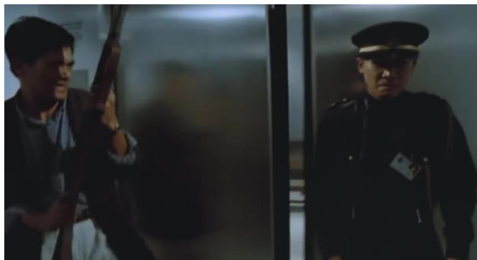
Slika 3.4 Kadar iz filma Lat sau san taam