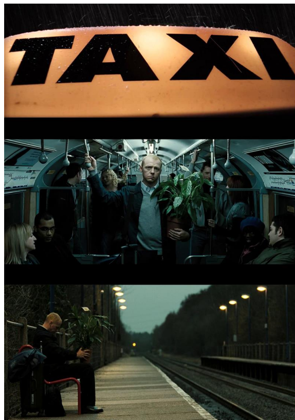
Slika 3.1 Sekvenca putovanja iz filma Hot Fuzz

Teško je odrediti idealno trajanje kadrova u sekundama. Generalno, kratak je kadar onaj kod kojeg gledatelj osjeti da u prikazanome nije vidio dovoljno. Rez nakon takvog kadra može se činiti prenaglim, ne daje vremena za reakciju, ali traje dovoljno dugo za percepciju sadržaja. Kada se pojavi samo jedan takav kadar, isti često ima ulogu sjećanja, no ne toliko nečega što je gledaoc već vidio, nego čega se lik prisjeća. Također može imati ulogu foreshadowinga . Gledaoc upije sadržaj, no još ne raspolaže s dovoljno informacija da ga poveže s ostatkom priče.