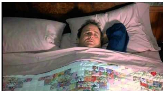
Slika 2.4 Poznati prizor Billa Murraya iz filma Groundhog Day

Zanimljiv hibrid obrnute i ponavljajuće strukture vidljiv je u Rashômonu . Film počinje pred sam kraj, zatim se više puta vraća unatrag (svako „ponavljanje“ zapravo je ista situacija iz perspektive drugog lika), nakon svakog vraćanja podsjećajući gledaoca da to nije stvarno vrijeme te da bi se na kraju filma dovršila radnja započeta na početku filma.