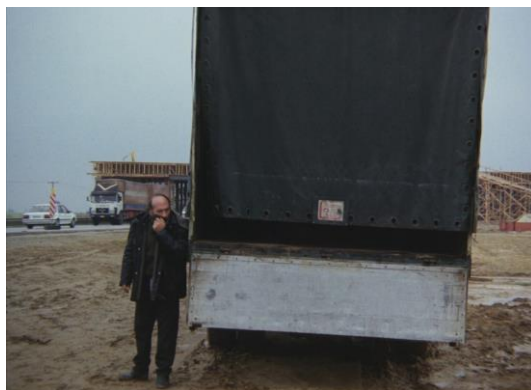
Slika 3.3 Kadar iz filma Topio stin omihli

Dvoje djece, dječak i djevojčica, putuju u potrazi za čovjekom za kojeg vjeruju da je njihov otac. Uz ostale pustolovine, dio puta ih vozi jedan starac u kamionu, no situacija se zakomplicira kada zaustavi vozilo kraj ceste, izađe van i kaže da mora prileći, pozove djevojčicu koja odbija i bježi. On ju tada silom odvlači u stražnji dio kamiona, gdje, odnosno kada, počinje spomenuti kadar.