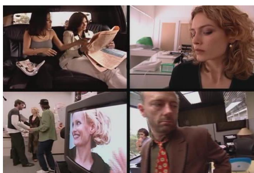
Slika 3.5 Prikaz razlomljenog ekrana u filmu Timecode