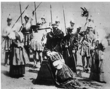
Slika 1.2 Prizor iz filma The Execution of Mary, Queen of Scots

Praktični dio rada sastojat će se od korištenja svog prikupljenog znanja i iskustva kako bi se sastavio scenarij i prema njemu snimio kratkometražni film u kojem će se više stanja svijesti glavnog lika personificirati i imati interakciju sa stvarnim (filmskim) svijetom.