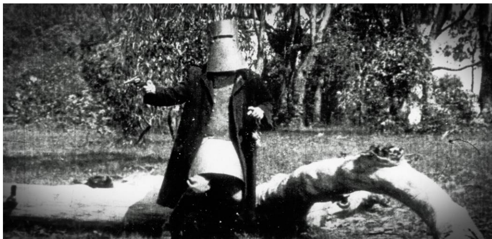
Slika 1. 1 Prizor iz filma The Story of the Kelly Gang

Bitno je napomenuti da je forma kratkometražnih igranih filmova zapravo služila kao početak igranog filma. U vrijeme kad su kreativci bili ograničeni tehnološkim (ne)mogućnostima, filmovi ni nisu mogli biti duljeg trajanja. Prvi „dulji“ igrani film (u trajanju od 60 minuta) snimljen je 1906. godine pod nazivom The Story of the Kelly Gang [1]. Dotad (naravno i kasnije) kratkometražna se forma većinom koristila za istraživanje specijalnih efekata. Jedan od prvih takvih primjera vidljiv je u filmu The Execution of Mary, Queen of Scots iz 1895., gdje se odrubljivanje ženine glave prikazuje na način da su svi glumci netom prije samog čina odrubljivanja stajali nepomično kako bi se glumica zamijenila lutkom. U montaži je bilo potrebno samo učiniti rez na pravom mjestu kako bi se gledaoca uvjerilo da je glumica stvarno dala svoj život za potrebe ovog filma. U vrijeme u kojem se film prikazivao, nije ni bilo teško uvjeriti publiku da je to što gledaju istina [2].