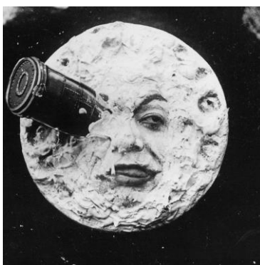
Slika 1.3 Poznati prizor iz filma A Trip to the Moon