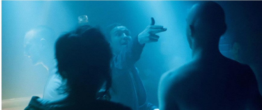
Slika 3.6 Prizor iz filma Victoria