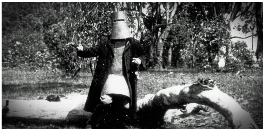
Slika 1. 1 Prizor iz filma The Story of the Kelly Gang

Bitno je napomenuti da je forma kratkometražnih igranih filmova zapravo služila kao početak igranog filma. U vrijeme kad su kreativci bili ograničeni tehnološkim (ne)mogućnostima, filmovi ni nisu mogli biti duljeg trajanja. Prvi „dulji“ igrani film (u trajanju od 60 minuta) snimljen je 1906. godine pod nazivom The Story of the Kelly Gang [1]. Dotad (naravno i kasnije) kratkometražna se forma većinom koristila za istraživanje specijalnih efekata. Jedan od prvih takvih primjera vidljiv je u filmu The Execution of Mary, Queen of Scots iz 1895., gdje se odrubljivanje ženine glave prikazuje na način da su svi glumci netom prije samog čina odrubljivanja stajali nepomično kako bi se glumica zamijenila lutkom. U montaži je bilo potrebno samo učiniti rez na pravom mjestu kako bi se gledaoca uvjerilo da je glumica stvarno dala svoj život za potrebe ovog filma. U vrijeme u kojem se film prikazivao, nije ni bilo teško uvjeriti publiku da je to što gledaju istina [2].