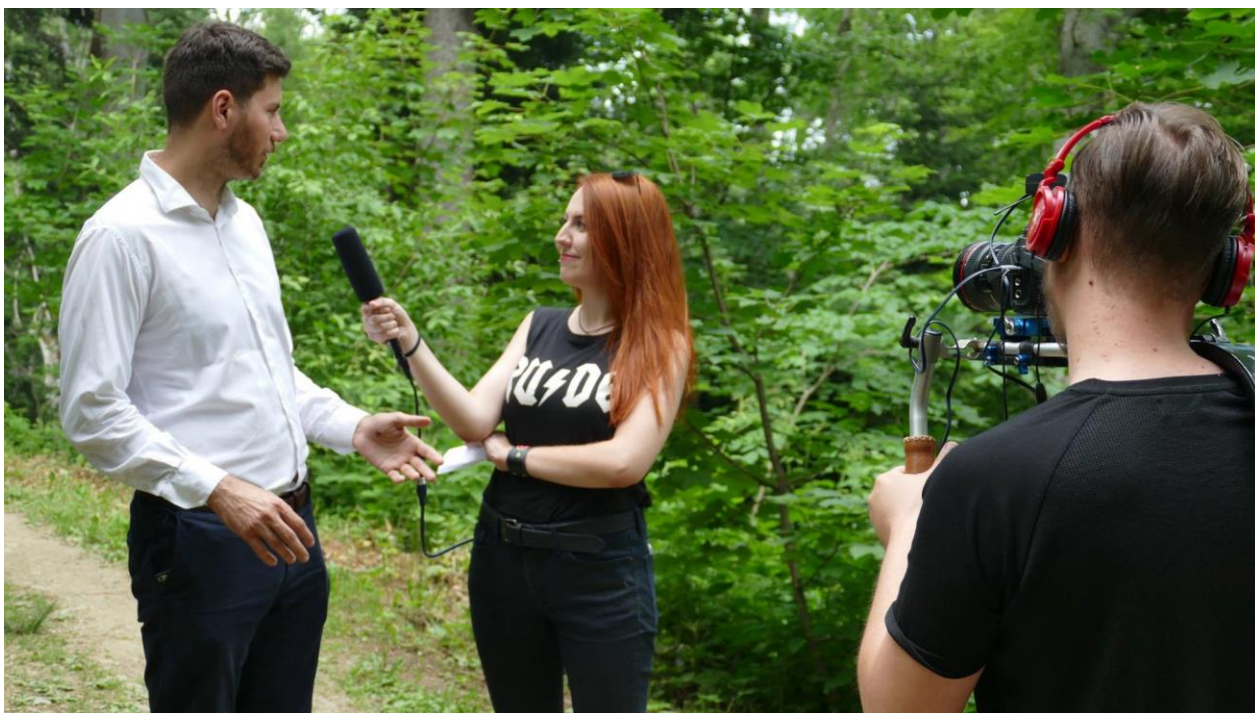
Slika 4.2.3. Cijeli intervju snimljen je u profesionalnim uvjetima