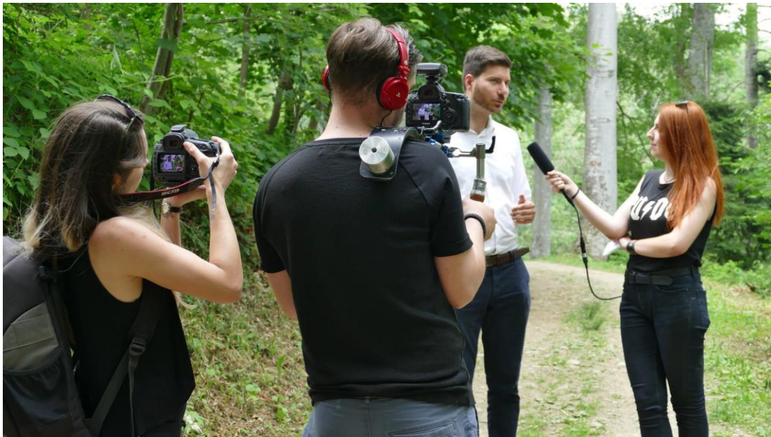
Slika 4.2.1. Snimanje intervjua na zagrebačkoj Medvednici