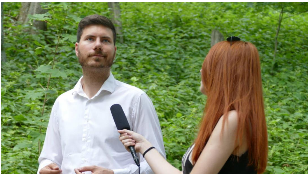
Slika 4.2.2. Zastupnik je opširno odgovarao na otvorena pitanja