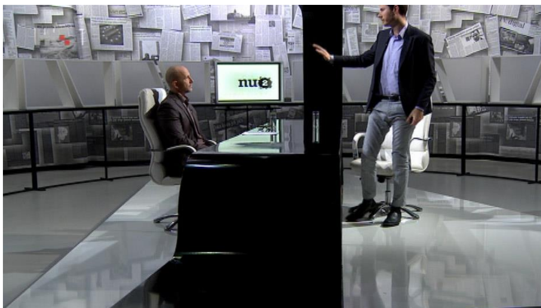
Slika 3.2.1. Ivan Pernar napustio je emisiju Nedjeljom u 2

Kako ga je voditelj više puta prekidao, Pernar je rekao da će napustiti razgovor ako ne bude imao pravo odgovoriti na pitanje do kraja. Kada ga je voditelj emisije vratio s Izraela na temu HRT-a, Pernar se ponovno pobunio da mu voditelj ne dopušta do kraja odgovoriti na postavljeno pitanje. I voditelj je također postao vidno uznemiren i ne baš prijateljski nastrojen prema gostu. Nakon što je rekao da je on ovdje voditelj i da on postavlja što on hoće, Pernar je izašao iz studija i prekinuo emisiju. Stanković je emisiju odjavio uz kratko obrazloženje. U medijima je nastala velika drama oko toga tko je zapravo u tom intervjuu bio „kriv“ odnosno tko nije poštivao pravila profesionalnog intervjua. Vjerojatno zbog takvoga završetka intervjua, taj je razgovor jedan od gledanijih sa saborskim zastupnikom Ivanom Pernarom.