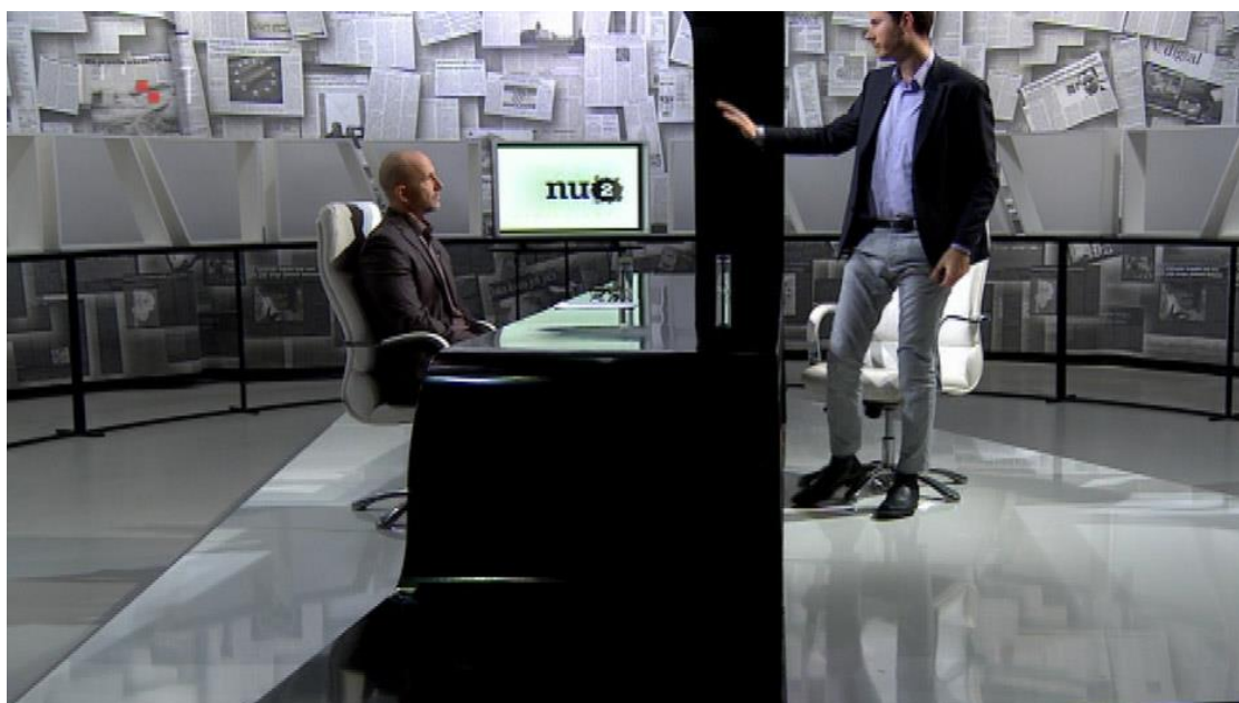
Slika 3.2.1. Ivan Pernar napustio je emisiju Nedjeljom u 2

Kako ga je voditelj više puta prekidao, Pernar je rekao da će napustiti razgovor ako ne bude imao pravo odgovoriti na pitanje do kraja. Kada ga je voditelj emisije vratio s Izraela na temu HRT-a, Pernar se ponovno pobunio da mu voditelj ne dopušta do kraja odgovoriti na postavljeno pitanje. I voditelj je također postao vidno uznemiren i ne baš prijateljski nastrojen prema gostu. Nakon što je rekao da je on ovdje voditelj i da on postavlja što on hoće, Pernar je izašao iz studija i prekinuo emisiju. Stanković je emisiju odjavio uz kratko obrazloženje. U medijima je nastala velika drama oko toga tko je zapravo u tom intervjuu bio „kriv“ odnosno tko nije poštivao pravila profesionalnog intervjua. Vjerojatno zbog takvoga završetka intervjua, taj je razgovor jedan od gledanijih sa saborskim zastupnikom Ivanom Pernarom.