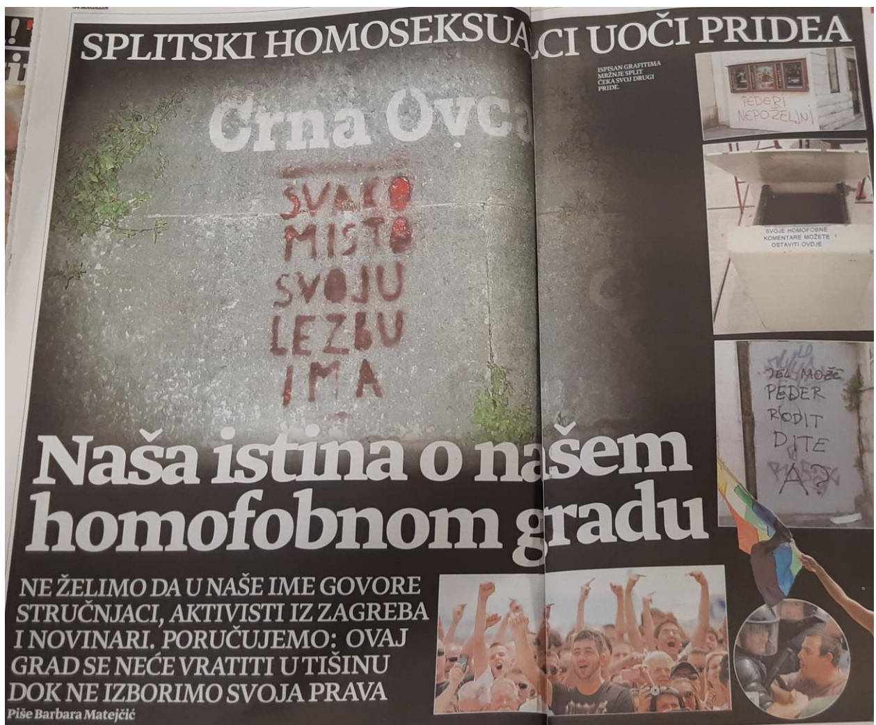
Slika 7.1.2. Naslovnica Subotnjeg izdanja Magazina Jutarnjeg lista 2012. godine