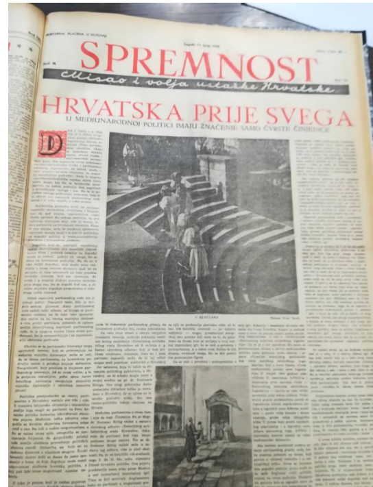
Slika 6.2- Spremnost: lipanj 1944., br. 121, str. 1

Isto tako, kroz druge naslove uvidalo se uporno protivljenje velikosrpskoj politici, a velika pozornost davala se strahu od boljševizma i njegovoj sve uočljivijoj infiltraciji u hrvatsko društvo.