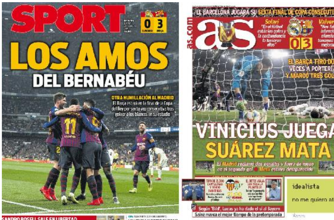
Slika 5.2. – Usporedba naslovnica španjolskih tiskovina Sport i AS-a

nasuprot njihovog velikog rivala. Naime, Barcelona je protekle sezone u gostima kod Real Madrida slavila 3:0 te tako prošla u finale Kupa kralja. Pobjedu „njihovog“ kluba Sport popratio je s naslovima „Gospodari Bernabeua“ i kako ističu „Još jedno ponižavanje Madrida“. S druge strane, AS na naslovnici ističe kako je Barcelona iz dva udarca zabila tri pogotka, ali su isto tako pronašli zamjerke u čistoj pobjedi gostiju koja im „krasi“ prednju stranu novina: „Real je tražio dva penala i ofsajd kod drugog gola koji je primio“ te „Messi je bio potpuno nevidljiv“.