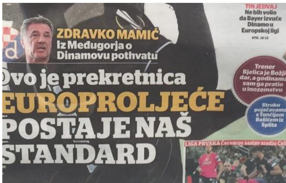
Slika 5.1. Naslovnica Sportskih novosti

Ipak, znale su se Sportske novosti naći na udaru javnosti zbog specifičnog načina pisanja o Zdravku Mamiću i GNK-a Dinamu. Recentni primjer može se pronaći kada su na naslovnici objavili komentar Mamića o Dinamovom uspjehu u Europskoj ligi, a kojega se tereti za niz nezakonitih radnji, dok je cijelu priču objavio portal Telegram.hr.