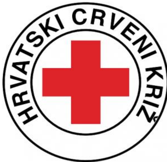
Slika 6.1 Kružni logo Hrvatskog Crvenog križa

Izvor: Zakon o načinu korištenja znaka crvenog križa u Hrvatskom Crvenom križu i njegovim ustrojstvenim oblicima, raspoloživo na https://narodne-novine.nn.hr/clanci/sluzbeni/2018_05_49_976.html , (pristupljeno 07.05.2020.)