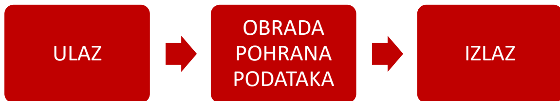
Slika 2.1. Shematski prikaz računovodstvenog procesa

U prvoj fazi, input računovodstvenog procesa predstavljaju knjigovodstvene isprave koje dokazuju nastanak poslovnih događaja koji su nastali unutar ili izvan poslovnog subjekta.