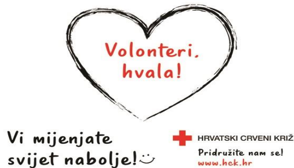
Slika 6.3 Zahvala volonterima povodom Svjetskog dana Crvenog križa i Crvenog polumjeseca