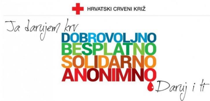
Slika 6.2 Plakat za darivatelje krvi