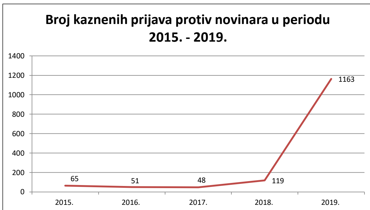
Grafikon 1. Prikaz amplitude pada i rasta ukupnog broja tužba za počinjena kaznena djela protiv časti i ugleda

Tablični prikaz s točnim brojevima, kao i vizualni prikaz amplitude pada i rasta zaista na najbolji način dočaravaju probleme u odnosu medija i javnosti. Prema dostupnim i gore navedenim podacima, kao i samom vizualnom prikazu istih, uistinu je vidljivo kako zadnjih godina vlada veliki pritisak na medije u obliku kaznenih prijava i tužba, pogotovo ako govorimo o 2019. godini. Tada je upravo iz navedenih razloga došlo do eskalacije i velikog prosvjeda u organizaciji Hrvatskog novinarskog društva pod nazivom „Oтели ste medije, novinarstvo ne damo!“