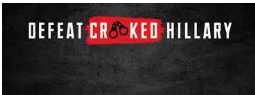
Slika 4. Logo kampanje "Defeat Crooked Hillary"

Ciljana populacija na koju se trebalo fokusirati su bile osobe bez čvrstog stava u odabranim saveznm državama. Kreativni tim CA-e kreirao je personalizirani sadržaj koji se tada plasirao targetiranim glasačima diljem svih digitalnih platformi koje ti korisnici koriste, sve dok ti pojedinci nisu vidjeli svijet na način koji je Trumpov tim htio, odnosno sve dok nisu odlučili svoj glas dati Trumpu. Spomenuti kreativni sadržaj podrazumijevao je javno sramoćenje H. Clinton, prikazivanje kandidatkinje u lažno negativnom svjetlu, a cijela kampanja protiv Clinton u poduzeću CA nazvana je „ porazimo prevaranticu Hillary “ (eng. „ Defeat Crooked Hillary “). Agresivnim plasiranjem u javnost sadržaja koji su stvarali negativnu sliku o Hillary Clinton postignuta je manipulacija američkih glasača, a kao rezultat takve manipulacije Clinton gubi predsjedničke izbore od Trumpa.