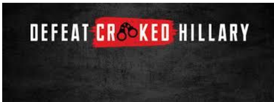
Slika 4. Logo kampanje "Defeat Crooked Hillary"

Ciljana populacija na koju se trebalo fokusirati su bile osobe bez čvrstog stava u odabranim saveznm državama. Kreativni tim CA-e kreirao je personalizirani sadržaj koji se tada plasirao targetiranim glasačima diljem svih digitalnih platformi koje ti korisnici koriste, sve dok ti pojedinci nisu vidjeli svijet na način koji je Trumpov tim htio, odnosno sve dok nisu odlučili svoj glas dati Trumpu. Spomenuti kreativni sadržaj podrazumijevao je javno sramoćenje H. Clinton, prikazivanje kandidatkinje u lažno negativnom svjetlu, a cijela kampanja protiv Clinton u poduzeću CA nazvana je „ porazimo prevaranticu Hillary “ (eng. „ Defeat Crooked Hillary “). Agresivnim plasiranjem u javnost sadržaja koji su stvarali negativnu sliku o Hillary Clinton postignuta je manipulacija američkih glasača, a kao rezultat takve manipulacije Clinton gubi predsjedničke izbore od Trumpa.