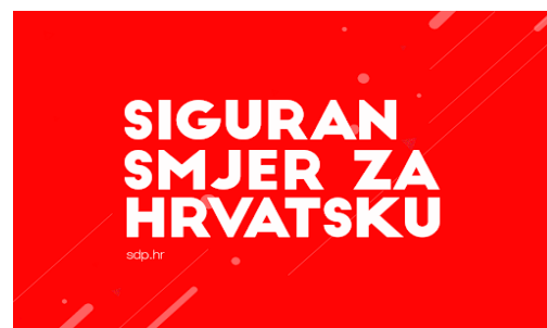
Slike broj 1 i 2: Izborni slogani HDZ i SDP za parlamentarne izbore 2016. godine slika 1 preuzeto sa: (3.3.2020.).

Od ostalih stranaka koje su igrale određenu, značajniju ulogu i u izbore su izlazili samostalno značajni su bili još i politička platforma MOST, sastavljena od niza lokalnih političara, te anarhijski politički pokret pod nazivom Živi Zid, a određeni broj glasova je osvajala izborna lista Milana Bandića. Ostale političke stranke i pojedinci su u istraživanjima javnog mijenja i popularnosti stranaka najčešće nisu prelazile izborni prag ili su osvajale minimalan broj mandata te im je jedina šansa za ulazak u Hrvatski Sabor bilo koaliranje sa nekom od većih političkih stranaka. Što se tiče političkih vođa kao što smo ranije rekli najznačajniji su bili Andrej Plenković na čelu HDZ i Zoran Milanović na čelu SDP. Od ostalih značajnih predstavnika političkih stranki ispred MOSTA je bio Božo Petrov, ispred Živog Zida je bio Ivan Vilibor Sinčić dok je listu Milana Bandića predvodio Milan Bandić, gradonačelnik Zagreba. Stranke su svoju kampanju bazirale najčešće na privlačnosti i prednostima svojih vođa. Tako je HDZ u prvi plan stavljao uspješnu diplomatsku karijeru Andreja Plenkovića, njegova poznanstva i ugled unutar Europske Unije, poznavanje jezika i uglađenost i odmjeranost u nastupu.