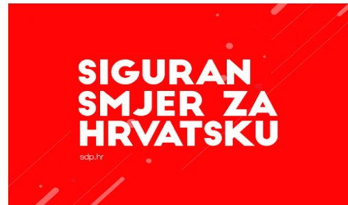
Slike broj 1 i 2: Izborni slogani HDZ i SDP za parlamentarne izbore 2016. godine slika 1 preuzeto sa: (3.3.2020.).

Od ostalih stranaka koje su igrale određenu, značajniju ulogu i u izbore su izlazili samostalno značajni su bili još i politička platforma MOST, sastavljena od niza lokalnih političara, te anarhijski politički pokret pod nazivom Živi Zid, a određeni broj glasova je osvajala izborna lista Milana Bandića. Ostale političke stranke i pojedinci su u istraživanjima javnog mijenja i popularnosti stranaka najčešće nisu prelazile izborni prag ili su osvajale minimalan broj mandata te im je jedina šansa za ulazak u Hrvatski Sabor bilo koaliranje sa nekom od većih političkih stranaka. Što se tiče političkih vođa kao što smo ranije rekli najznačajniji su bili Andrej Plenković na čelu HDZ i Zoran Milanović na čelu SDP. Od ostalih značajnih predstavnika političkih stranki ispred MOSTA je bio Božo Petrov, ispred Živog Zida je bio Ivan Vilibor Sinčić dok je listu Milana Bandića predvodio Milan Bandić, gradonačelnik Zagreba. Stranke su svoju kampanju bazirale najčešće na privlačnosti i prednostima svojih vođa. Tako je HDZ u prvi plan stavljao uspješnu diplomatsku karijeru Andreja Plenkovića, njegova poznanstva i ugled unutar Europske Unije, poznavanje jezika i uglađenost i odmjerenost u nastupu.