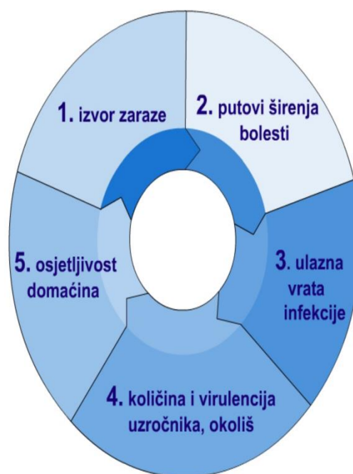
Slika 3.1.1.1. Vogralikov lanac