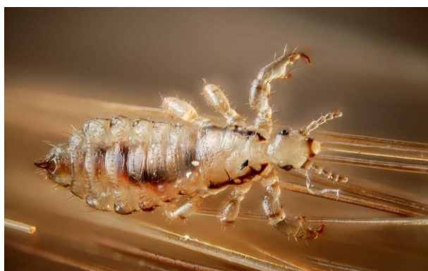
Slika 2.1.1. Makro-anatomski prikaz uši glave

Kada se govori o anatomskim karakteristikama uši glave, spominje se kratka i uska glava s dvije antene na vrhu koje su podijeljene u pet dijelova. Grudni koš je kompaktan, a trbušni dio, podijeljen na sedam dijelova, membranozan je sa bočnim paratergalnim pločama [8]. Tijelo uši glave prekriveno je kutikulom koja može biti obojena, a stupanj obojenosti može reflektirati boju kože domaćina [9]. Makro-anatomski prikaz uši glave prikazan je na slici 2.1.1.