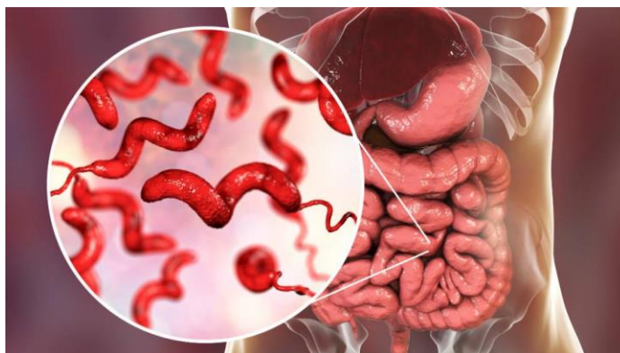
Slika br. 3.4. Prikaz bakterije kampilobaktera

Crijevna akutna infektivna bolest, pojavljuje se kao dijareja nakon inkubacije od 1-7 dana. Campylobacter jejuni ( C. jejuni ) i Campylobacter coli ( C. coli ) najčešći crijevni kampilobakteri, uzrokuju upalu, stvaranje sitnih apscesa i nekrozu nakon prodiranja u sluznicu tankog i debelog crijeva. Izvor zaraze je meso peradi i domaćih životinja, pitka voda te kućni ljubimci, pa tako zaključujemo da je kampilobakterioza rasprostranjena zoonoza. Također, feko-oralne zarazne bolesti moguće su uglavnom kod djece. Klinička slika može biti od blagog enterokolitisa pa sve do težih oblika bolesti što uključuje vrućicu, obilne i katkada krvave proljeve. Trajanje je moguće do 7 dana te je uglavnom samoograničenog tijeka. Liječenje kod većine pacijenata nije potrebno, već je potrebno nadoknađivanje tekućine i elektrolita [12].