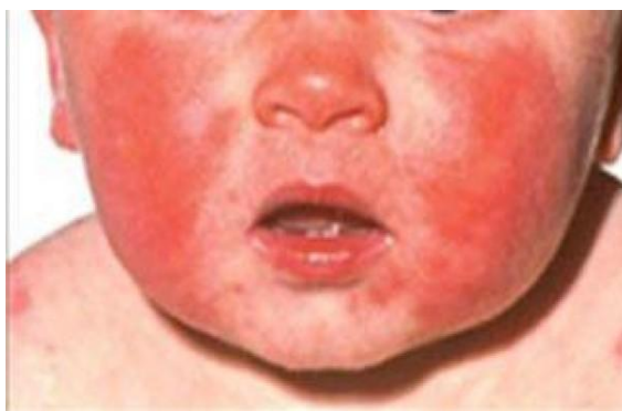
Slika 4.2. Prikaz karakterističnog izgleda osipa za petu bolest

Dijagnoza se postavlja na temelju karakterističnog izgleda osipa, kliničkim obilježjima te dokazivanjem protutijela na parvovirus B19 ili na njegov DNA. Liječenje je simptomatsko, kod bolova primjenjuju se analgetici ali najčešće liječenje nije potrebno [27].