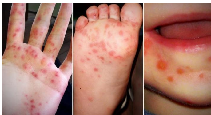
Slika br. 4.1. Prikaz osipa kod bolesti šake, stopala i usta

Od trenutka kada je dijete izloženo bolesti, potrebno je 3 do 6 dana da se pojave prvi simptomi. Obično počinje sa vrućicom, grloboljom i curi nosom - slično kao kod prehlade - ali tada se osip s sitnim žuljevima može pojaviti na tijelu. Simptomi su najgori u prvih nekoliko dana, ali obično potpuno nestanu u roku od tjedan dana. Ljuštenje prstiju i nožnih prstiju nakon 1 do 2 tjedna može se dogoditi, ali je bezopasan. Bolest se dijagnosticira fizičkim pregledom, kliničkom slikom te anamnezom. Bolest je virusna, tako da se liječenje provodi simptomatski [21]. Nakon dijagnoze, ukoliko dijete pohađa odgojno- obrazovnu ustanovu, potrebno je obavijestiti nadležne zbog mogućnosti širenja zaraze.