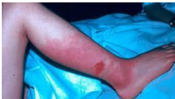
Slika br. 3.3. Prikaz erizipela na podkoljenici

Crveni vjetar ili erizipel je lokalna kožna i potkožna akutna streptokokna infekcija uzrokovana beta-hemolitičkim streptokokom grupe A, sa općim simptomima i tipično ograničenim crvenilom i oteklinom. Inkubacija je kratka i traje 1-5 dana a prenosi se izravnim kontaktom. Umjerena bolnost, oteklina i crvenilo pojavljuje se na zahvaćenom dijelu tijela. Može se pojaviti bilo gdje na tijelu, ali je najčešća na licu i nogama. Uspješno se liječi penicilinom te hladnim oblozima na mjestu zahvaćenosti [2][12].