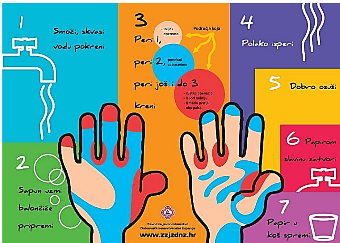
Slika br. 6.1. Plakat o pranju ruku za vrtiće

Najbolja prevencija zaraznih bolesti jest redovito cijepljenje protiv određenih zaraznih bolesti, što je u današnje vrijeme vrlo dobro istraženo i ispitano.