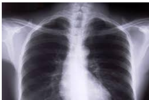
Slika br. 3.5. Prikaz RTG slike upale pluća

Upala pluća uzrokuje niz zaraznih uzročnika, uključujući viruse, bakterije i gljivice. Najčešći su Streptococcus pneumoniae što je najčešći uzrok bakterijske pneumonije u djece, Haemophilus influenzae tip b (Hib) kao drugi najčešći uzrok bakterijske pneumonije respiratorni sincicijski virus najčešći je virusni uzrok upale pluća, a u dojenčadi zaražene HIV-om (virusom humane imunodeficijencije), Pneumocystis jirovecii jedan je od najčešćih uzroka upale pluća, odgovoran za najmanje četvrtinu svih smrti od upale pluća kod novorođenčadi inficirane HIV-om. Pneumonija se može širiti na više načina. Virusi i bakterije koji se obično nalaze u djetetovom nosu ili grlu, mogu zaraziti pluća ako ih se udiše. Također se mogu širiti kapljičnim putem preko kašljanja ili kihanja. Uz to, upala pluća može se širiti krvlju, osobito tijekom i nedugo nakon rođenja djeteta kod poroda. Dok se većina zdrave djece može boriti protiv infekcije prirodnom obranom, djeca čiji je imunološki sustav ugrožen, izložena su većem riziku od razvoja upale pluća. Upala pluća liječi se antibioticima te osiguravanjem pogodnih okolišnih čimbenika, poput prozračivanje zraka onečišćenih zatvorenih prostorija. Poticanje dobre higijene u kućama sa više ukućana ili u vrtićima, također smanjuje broj djece oboljele od upale pluća [14].