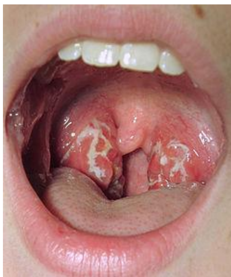
Slika br. 3.1. Prikaz gnojnih naslaga na krajnicima kod angine

Streptokokna angina ima visoko javnozdravstveno značenje, zbog svoje učestalosti i zbog mogućnosti epidemijske pojavnosti u dječjim kolektivima [2][12].