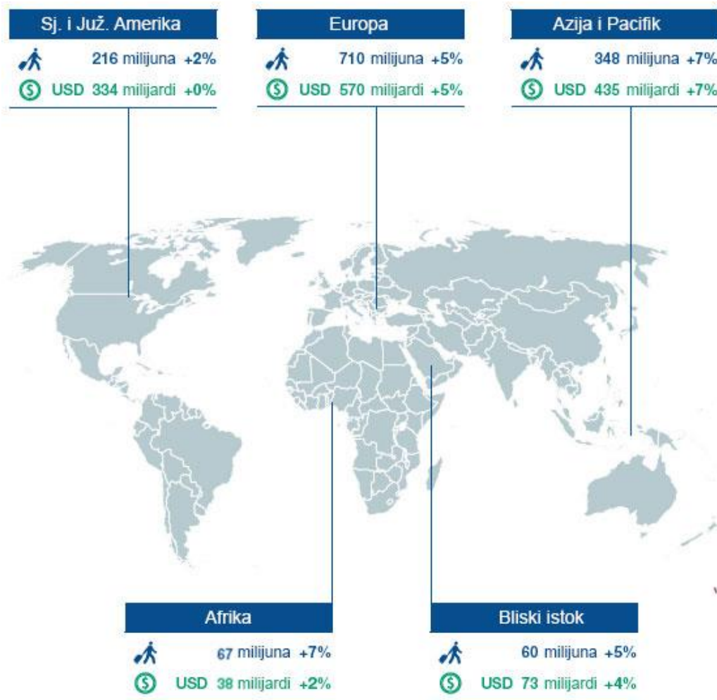
Grafika 2: Karta međunarodnih turističkih dolazaka (milijuni) i zarade od turizuma (milijarde USD).