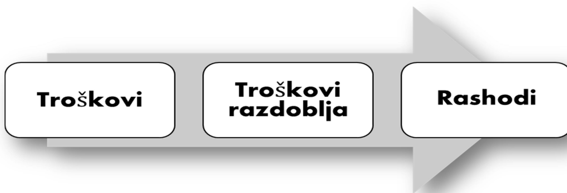
Slika 1. Tijek kretanja troškova razdoblja

Puno je jednostavnija evidencija troškova razdoblja, nego evidencija troškova proizvoda. Oni su uvijek dospjeli troškovi, a sastoje se od troškova administracije i prodaje. Za razliku od troškova proizvoda, koji prate cijeli proces proizvodnje, kod troškova razdoblja postoji jednostavniji način evidencije. Njih se priznaje odmah u trenutku nastanka i nadoknađuju se iz prihoda koji su nastali u istom obračunskom razdoblju. Dakle, s konta 491 se prenosi direktno na rashod (Guzić, Š. et al. 1999;568).