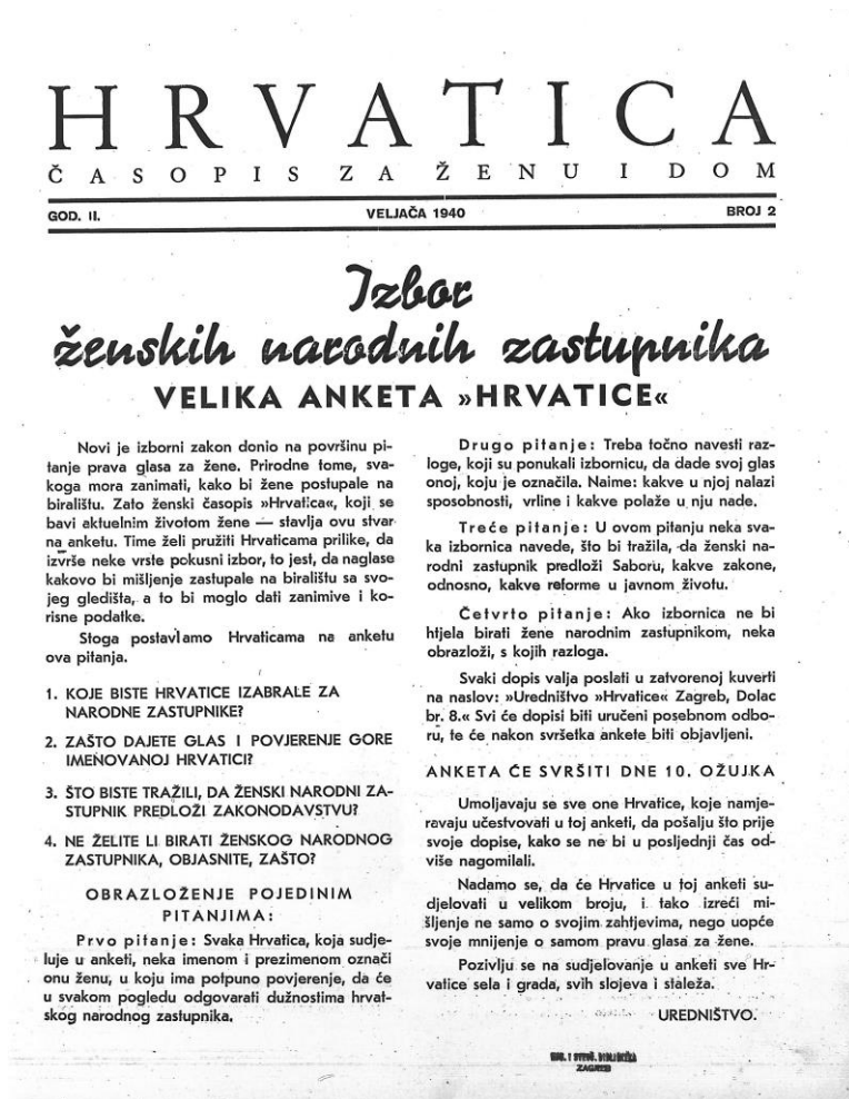
Slika 6.1.1.1. Primjer ankete u Hrvatici

postići ovom anketom. Zagorka otkriva kako je pristiglo oko 3000 pisama, koje će ona čuvati kao uspomenu. Da je uistinu čuvala njihova pisma te na ista namjeravala odgovoriti, potvrđuje činjenica da su nakon njezine smrti u stanu pronađena brojna pisma i bilješke na marginama pisama (Dujčić i Trgovac Martan 2016: 266). Na temelju navedenoga možemo potvrditi Zagorkin uistinu ogroman utjecaj na žene/čitateljice – kako njezinim novinarskim priložima, tako i romanima.