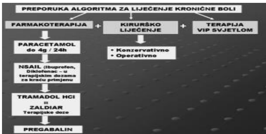
Slika 4.2.1. Prikaz preporuke algoritama za liječenje kronične bolesti sa vrstama analgetika

Njihova svrha je liječenje neuropatske boli. U takvoj situaciji prednost u primjeni daje se pregabalinu jer se on lakše podnosi i uzrokuje manje nuspojave. Neki od preporučenih vrsta analgetika prema mehanizmu njihovih djelovanja prikazani su u liječenju kronične boli na slici 4.2.1. [31].