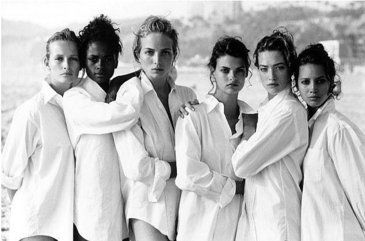
Slika 3.2.1.: Peter Lindbergh, Estelle Lefébure, Karen Alexander, Rachel Williams, Linda Evangelista, Tatjana Patitz, Christy Turlington, Santa Monica, California, SAD, 1988. godine