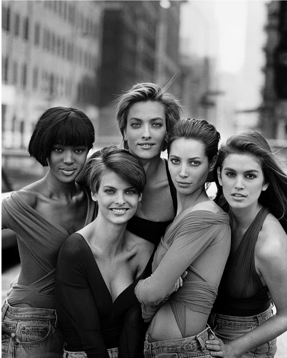
Slika 3.2.2.: Peter Lindbergh, Naomi Campbell, Linda Evangelista, Tatjana Patitz, Christy Turlington and Cindy Crawford, New York, 1989. godine