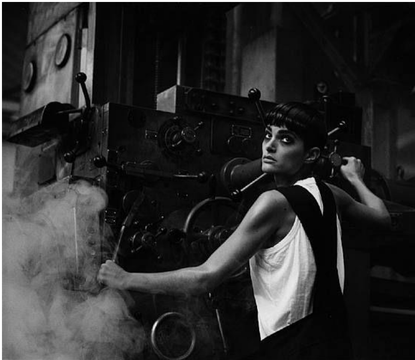
Slika 3.1.1.: Peter Lindbergh, Comme Des Garçons, 1984. godina

Peter Lindbergh svoj stil razvija kroz inspiraciju dokumentarnom fotografijom Dorothee Lange, Henrija Cartier-Bressona i Garryja Winogranda. Njegov stil odiše fotografskim realizmom koji modela stavlja u čista netaknuta stanja, uz minimalnu šminku i ležerno stilizirano izdanje. [8] Lindbergh također svoju inspiraciju crpi iz ranog narativa kina i ulične fotografije. Na oblikovanje njegovog stila uvelike je utjecalo i njegovo podrijetlo te okolina u kojoj je odrastao, industrijski grad sjeverne Njemačke. Njegovo podrijetlo može se vidjeti u oštrom i bezumnom realizmu koji uokviruje žensku ljepotu. [9] „Lindbergh je prvi fotograf koji je u svoju modnu seriju uključio narativ, a njegovo pripovijedanje donosi novu viziju umjetnosti i modne fotografije.“ [7] Stil kojim Lindbergh stvara svoje fotografije može se nazvati modno-dokumentarna fotografija.