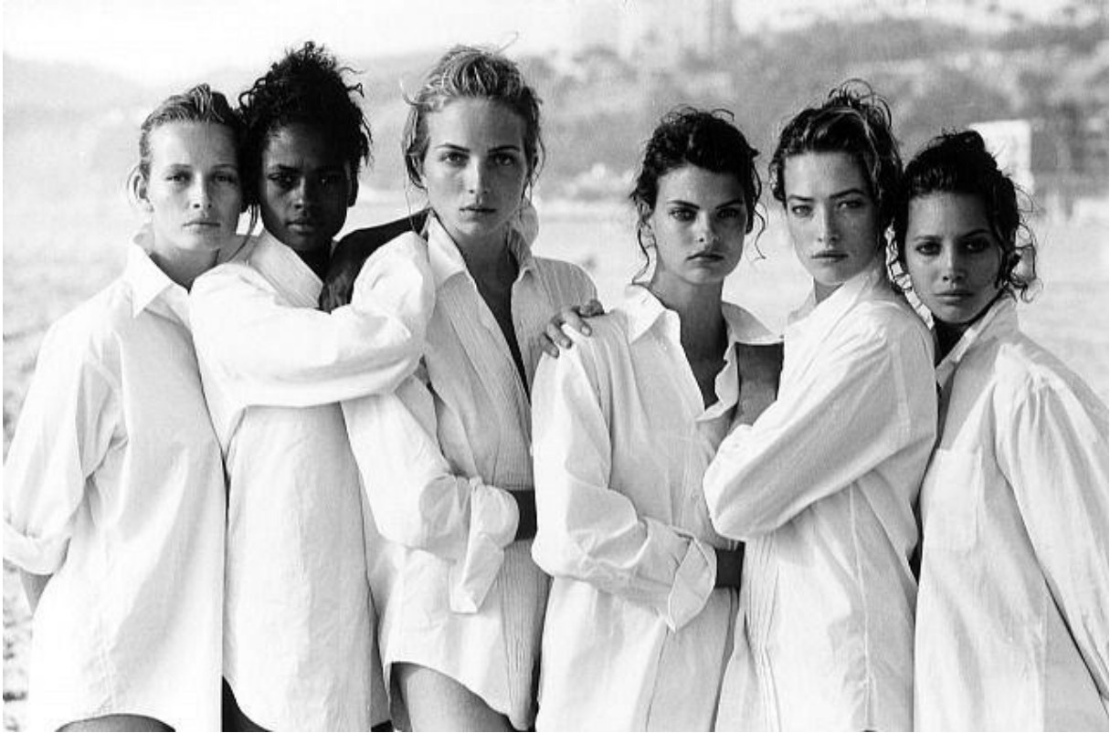
Slika 3.2.1.: Peter Lindbergh, Estelle Lefébure, Karen Alexander, Rachel Williams, Linda Evangelista, Tatjana Patitz, Christy Turlington, Santa Monica, California, SAD, 1988. godine