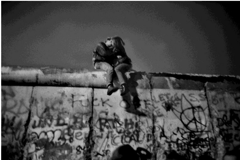
Slika 2.2.2.: Berlin, blizu Branderburških vrata, 1989. godine

dokumentiranja ratnih događanja. Nakon rata fotografi Henri Cartier-Bresson, Robert Capa, George Rodger i David 'Chim' Seymour osnovali su fotografsku agenciju „Magnum“. Agencija je bila osnovana kako bi dokumentirala stvarnost poslijeratnog života. [4]