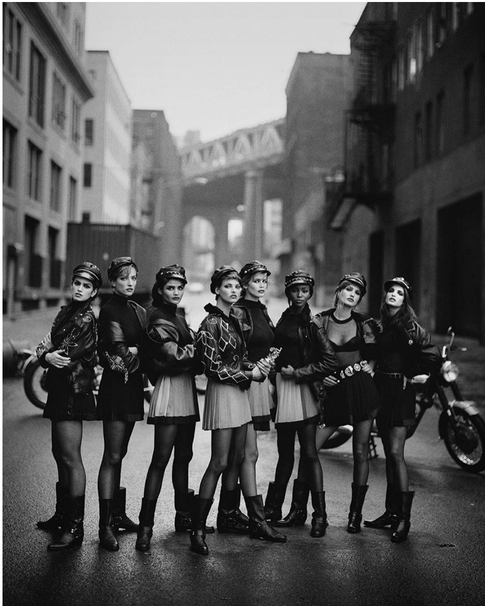
Slika 3.2.4.: Peter Lindbergh, Cindy Crawford, Tatjana Patitz, Helena Christensen, Linda Evangelista, Claudia Schiffer, Naomi Campbell, Karen Mulder, Stephanie Seymour, American Vogue, Brooklyn, New York, 1991. godine