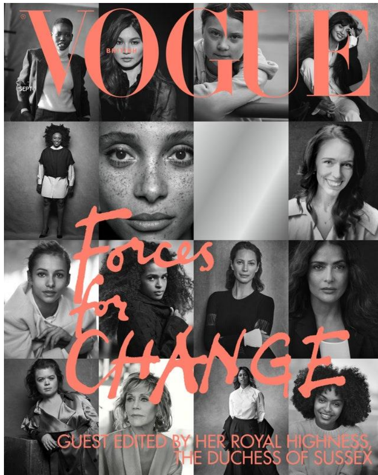
Slika 3.1.3.: Peter Lindbergh, "Forces for Change", Vogue, rujna 2019. godine

Peter Lindbergh preminuo je 3. rujna 2019. godine u Parizu. [6]