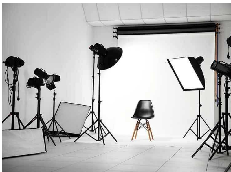
Slika 2.2.1. Fotografski Studio

Portretna fotografija je u svom početku zahtjevala da osobe sjede nepomično u trajanju od čak jedne minute, u današnje moderno doba nije potrebna niti jedna sekunda. Prvi portreti su ozbiljni i bez pretjeranih emocija pošto je puno lakše 1 minutu biti ozbiljan nego se smijati ili raditi neke grimase. Naravno s napredkom tehnologije napredovala je i mogućnost ekspresije tokom fotografiranja portreta.