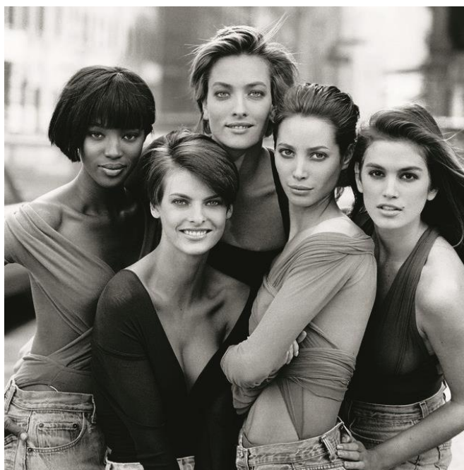
Skila 2.4.1 Peter Lindbergh Vogue 1990

Od 1939.godine nadalje, ono što je bila procvat i značajna industrija moden fotografije naglo staje zbog početka Drugog svjetskog rata. Sjedinjene Države I Europa se razilaze I započinju svoje stilove. Fotografije u SAD-u dobivaju izrazitu Americana atmosferu, modeli su pozirali s zastavama, automobilima američke marke i uglavnom ispunjavali američke ideale. S druge strane Europska modna fotografija počinje dokumentirati strahote rata u modnom okviru. Modeli poziraju uz ruševine nekad velikih gradova, nose najnovije plinske maske, voze se biciklom s viklerima u kosu zbog neimanja struje kojom bi uvijale kosu. Iako mnogi smatraju da je modna fotografija tokom rata bila neozbiljna I nepotrebna, te fotografije nam prikazuju modnu emociju tog vremena. [8]