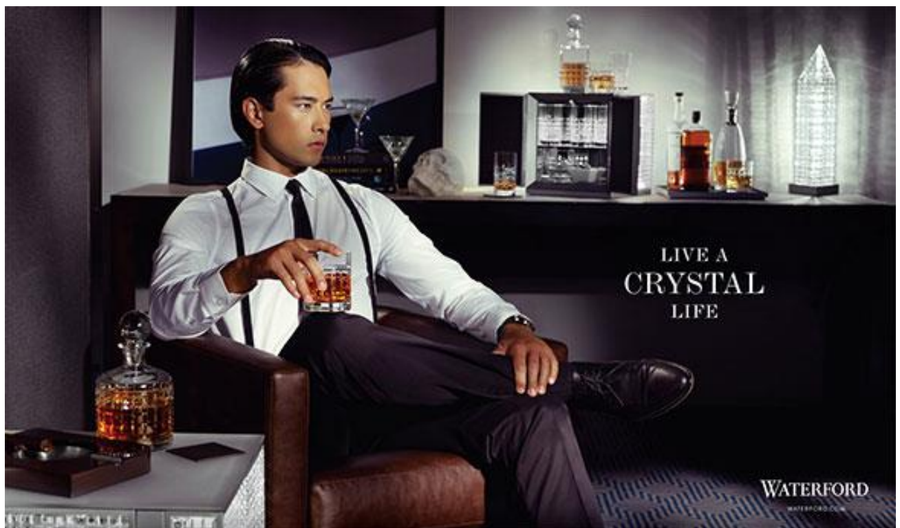
Slika 2.6.1 Waterford Live a Crystal Life

Karakter profesionalnih studija počinje se mjenjati 1920-ih godina. Upotreba fotografije u svrhe reklamiranja psotaje sve učestalija. Većina novih studija svoj rad prilagođava komercijalnim klijentima. Neki se specijaliziraju za modu ili hranu, dok neki na stvaranje maštovitih iluzija za promociju raznih industrija ili proizvoda. [11]