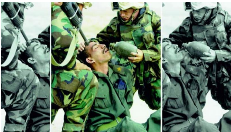
Slika 2.3.1.3. Media Manipulation AP News

Dolaskom novinske fotografije u moderna vremena sve češće se javlja upitnost konteksta. Iskorištava se kut fotografiranja i rezanje fotografija kako bi se prikazala željena a ne realna slika. Samim tim se izobličuje i ljudska emocija u fotografiji, šta u jednom trenutku izgleda kao želja za pomoći lako se pretvara u mržnju. Jednostavne prijateljske geste postaju provokacije.