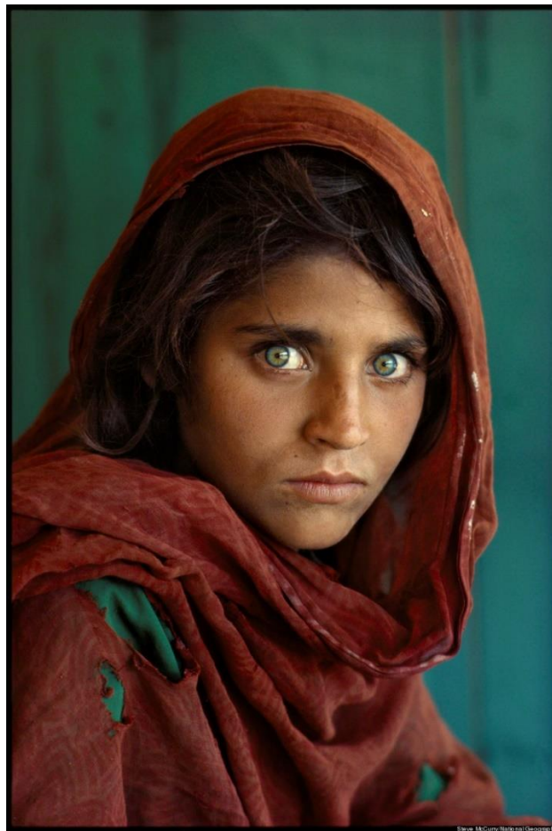
Slika 2.5.1 Steve McCurry young Afghan girl

Niska cijena dagerotipije sredinom 19. stoljeća i smanjenje vremena koje je potrebno da se zabilježi fotografija, iako još uvijek puno duža nego današnja, uvelike su pripomogle popularnosti portretne fotografije u odnosu na slikane portrete. Stil ranih portreta imao je tehničke izazove u obliku duge vremenske izloženosti i slikarskoj estetici tog vremena. Iz ove poteškoće prizašla je skrivena majčina fotografija, u kojoj su majke male djece bile skrivene izvan kadra kako bi svojim prisustvom smirile svoju djecu te im zadržale fokus na sebe. Subjekti su sjedili ispred neutralne pozadine osvjetljeni blagim svjetlom. Napredak u fotografskoj opremi i tehnikama razvoja i fotografiranja uvelike su pomogle u samoj izradi portretnih fotografija. [9]