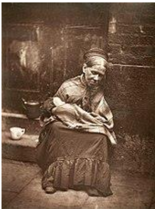
Slika 2.3.1.1. John Thomson The Crawlers

Popularna tema rane novinske fotografije je bila ulična fotografija. Prikazivali su se uvjeti života, događaji i razna društvena okupljanja.