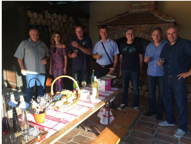
Slika 5. Obiteljsko poljoprivredno gospodarstvo „Gašpić“