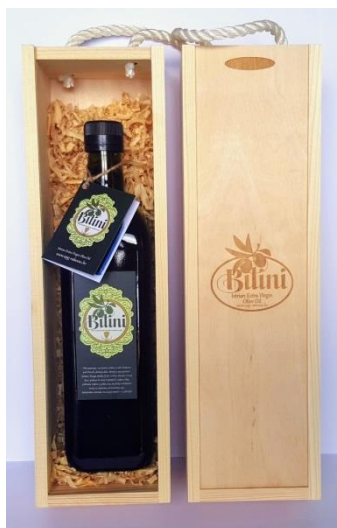
Slika 10. Maslinovo ulje OPG-a „Rakovac“