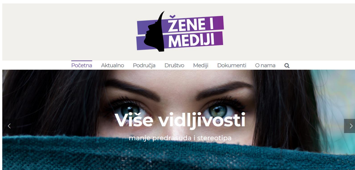
Slika 2 Naslovna strana portala Žene i mediji

Uz samo pisanje na portalu, korisnici se mogu uključiti i u razne kampanje te konferencije koje se organiziraju.