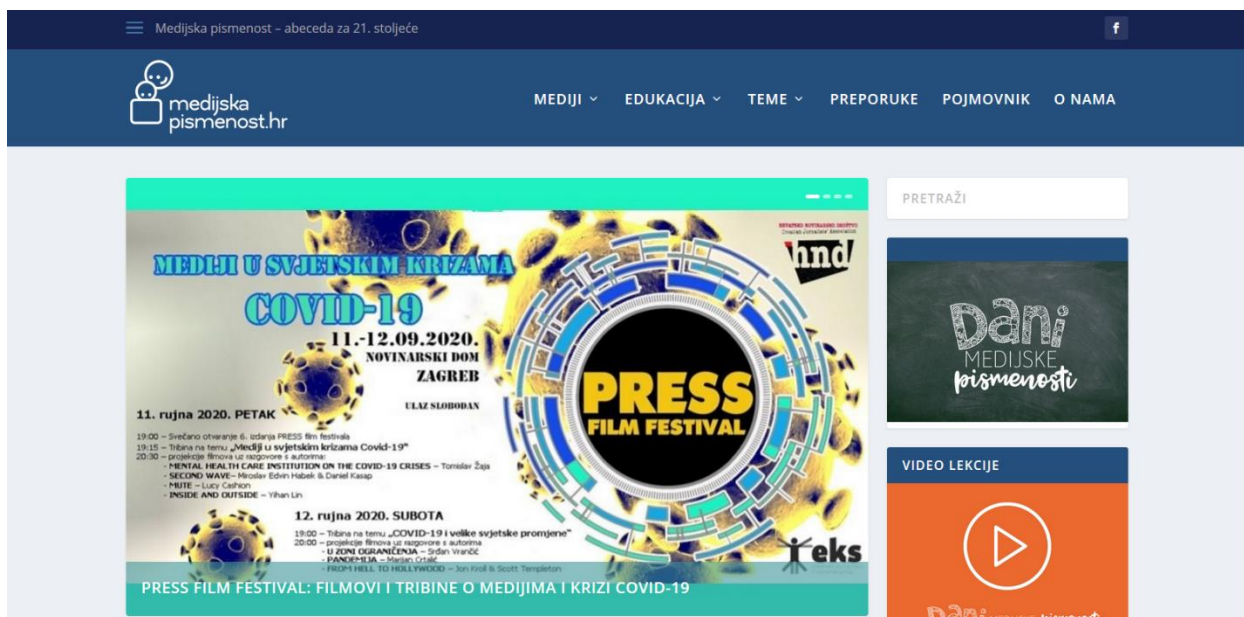
Slika 3 Naslovna strana portala Medijska pismenost – abeceda za 21. stoljeće