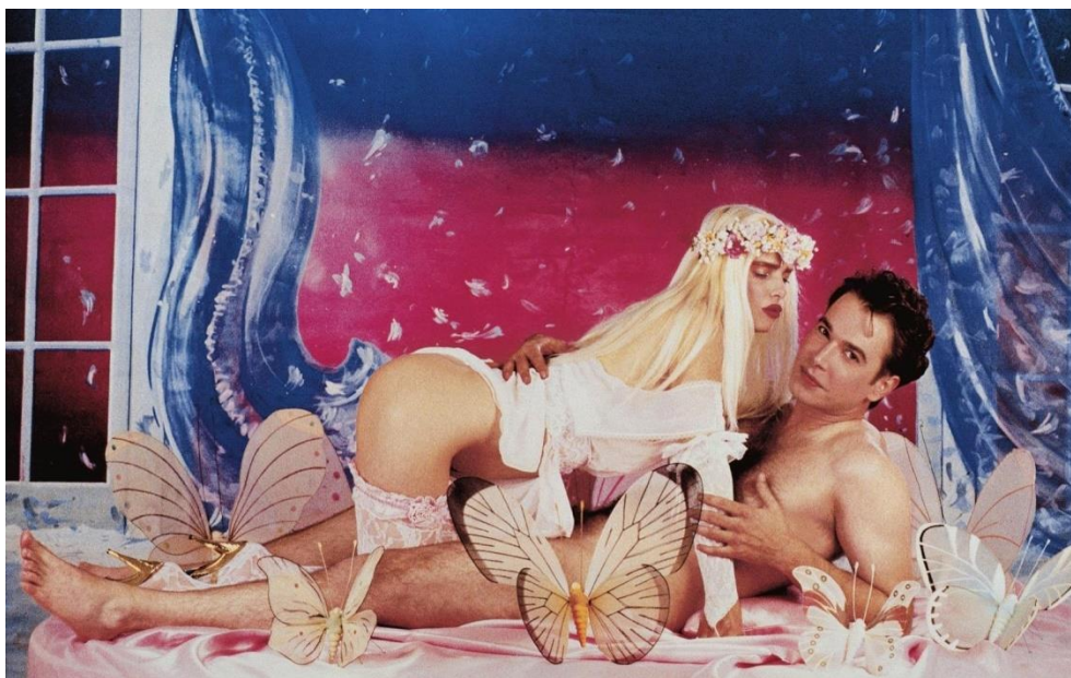
Slika 3.3.1. Made in Heaven , fotografija iz serije autora Jeffa Koonsa

Porno-šik je u javnu sferu ušao na vrata umjetnosti. Iako je naznaka porno-šika u umjetničkom izražavanju postojala već u 60-ima, tek kao kulturni trend je prihvaćen u razdoblju kraja 80-ih, odnosno početka 90-ih. McNair spominje seriju fotografija i skulptura Made in Heaven američkog umjetnika Jeffa Koonsa kao jedan od prvih primjera umjetničkih porno-šikova, a koja je prikazivala njega i njegovu suprugu Cicciolinu (poznatu talijansku porno zvijezdu) u spolnom odnosu (McNair 2004: 73). Iako seksualno eksplicitna i bez obzira što mašti ostavlja malo toga, ova serija vrednuje se kao umjetnička, a u javnosti je imala dovoljno odjeka da se u medijima često koristi kao ilustracija uz prikladne tekstove i članke u novinama i časopisima. Tako Made in Heaven možemo slobodno uvrstiti kao datum početka poigravanja elementima pornografije u kulturnoj i medijskoj sferi (McNair 2004: 74).