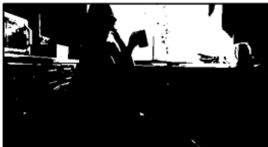
Nastavak kadra 1.3.1

Kadar se snima odjednom u pokretu gimbal prati nju od stavljanja džezve pa sve do sjedanja za stolac i ispijanja kave