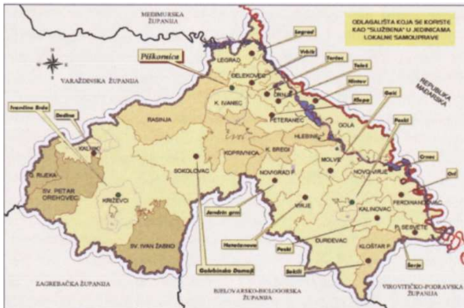
Slika 4. Službene deponije na području županije 37

U današnje vrijeme život bez vode gotovo je nezamisliv. Voda je glavni resurs u kućanstvu, piću, prehrani, higijeni, industriji, itd. Ljudi sve više zanemaruju njenu vrijednost i olako je zagađuju. Onečišćenje vode podrazumijeva njenu neupotrebljivost za piće. Do onečišćenja dolazi iz mnogobrojnih razloga. U ovom slučaju, na području grada Križevaca riječ je o deponijama koji uzrokuju opadanje kvalitete podzemnih voda.