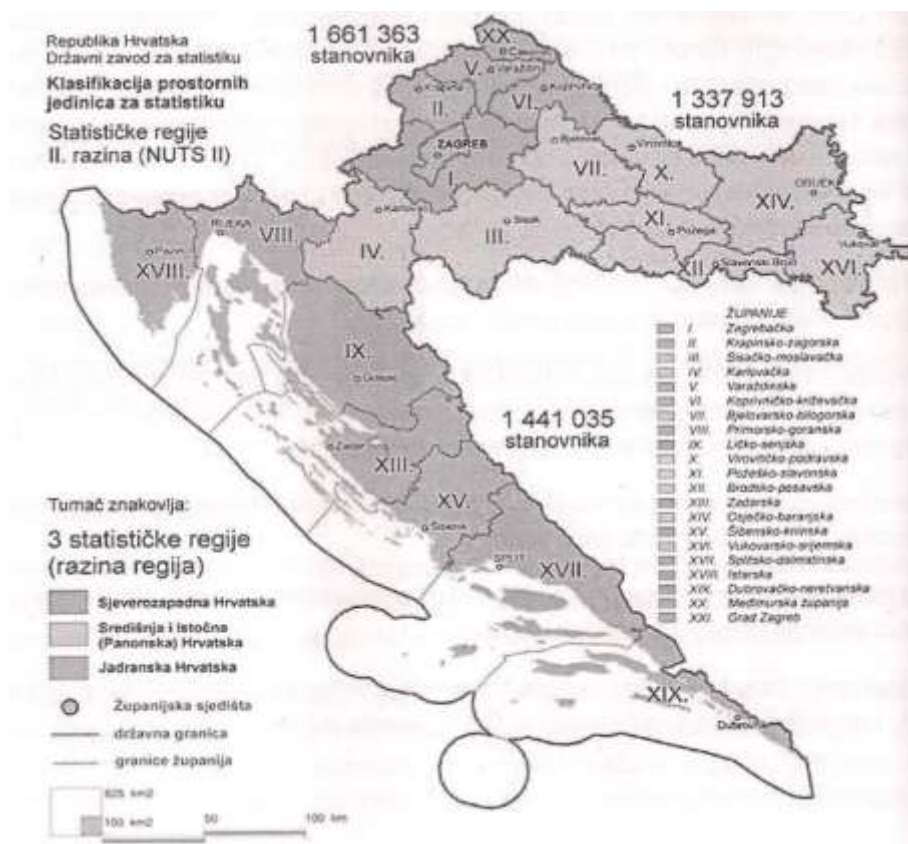
Slika 2. Podjela Hrvatske na NUTS II regije 7

„Kohezijska i regionalna politika EU – a teži ostvarenju ujednačenog gospodarskog i socijalnog razvoja cijelog teritorija EU – a, kako bi se osigurala dugoročna ekonomska i monetarna stabilnost te iskazala solidarnost.“ 6