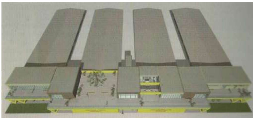
Slika 3. Razvojni centar i tehnološki park u prostoru bivše vojarnе u Križevcima – idejno rješenje 23

Objekt se nalazi na prostoru bivše križevačke vojarnе. U sklopu objekta smješteni su kafić, laboratoriji koji služe poduzetnicima za unapređivanje njihova poslovanja, proizvodnja prirodne kozmetike (Tinktura), osiguranje, papirnica, knjigovodstveni servis, skladišta, konferencijska dvorana, poslovni prostori, pametne klupe.