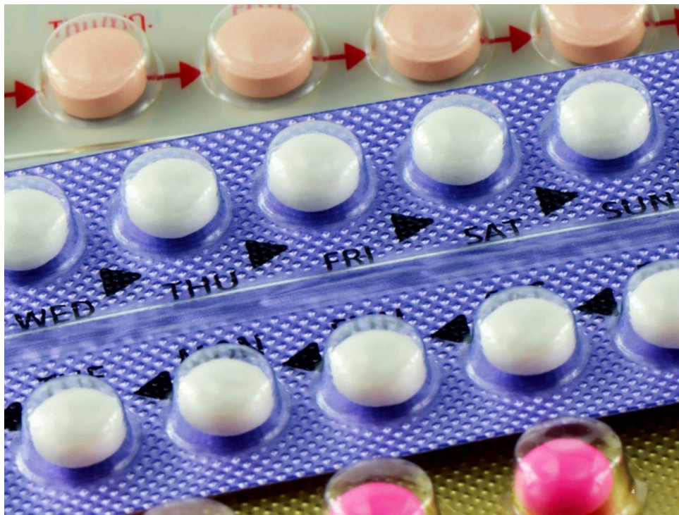
Slika 3.1. Prikaz pakiranja oralne hormonalne kontracepcije