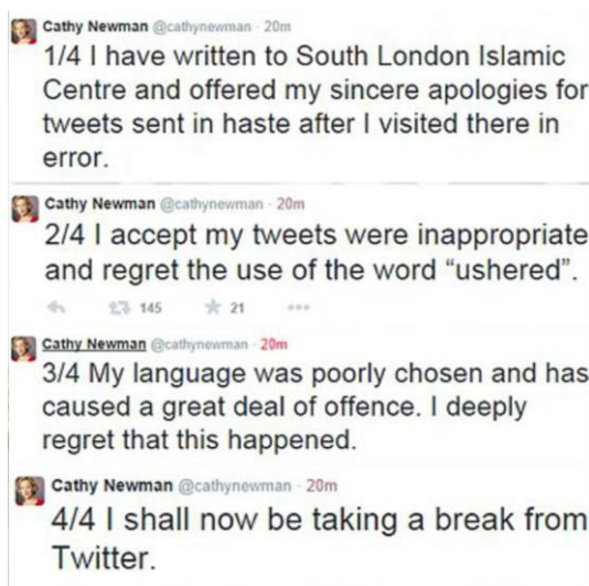
Slika 6.3.2.1. Isprika Cathy Newman na Twitter računom 87

policija. Dva dana nakon toga viralna je postala snimka na kojoj se vidi da Newman nitko nije „istjerao“ iz džamije. 85 Newman se morala javno ispričati, zajedno s redakcijom Channel 4 News koja je cijelu priču medijski popratila: „To je bilo glupo. To je bio glupi, glupi tweet; prouzročio je golemi nesporazum.“ 86