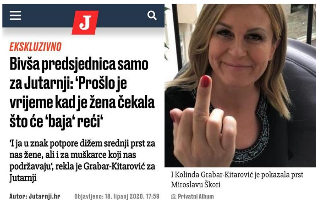
Slika 5.2.1.1. Kolinda Grabar-Kitarović pokazuje srednji prst Miroslavu Škori 13

Kada je Kolinda Grabar-Kitarović, kao bivša predsjednica, u lipnju 2020. prije parlamentarnih izbora za Jutarnji list pokazala srednji prst Miroslavu Škori i Nini Raspuđiću, domaći su mediji do otvaranja birališta pisali o ovoj temi. Slika je popraćena naslovom „Bivša predsjednica samo za Jutarnji: 'Prošlo je vrijeme kad je žena čekala što će 'baja' reći.“ 12