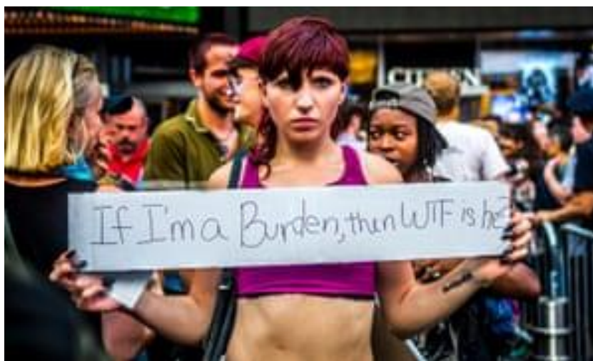
Slika 6.4.2.1. Priložena fotografija uz recenziju Petersonove knjige na portalu The Guardian 94

Uz članak je objavljena sljedeća fotografija: