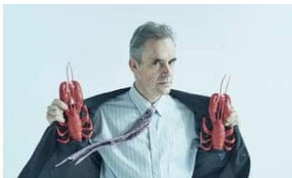
Slika 6.3.1.1. „Nisi tako dobar kao što misliš. I nisi tako beskoristan kao što misliš.“