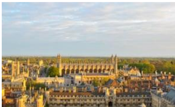
Slika 6.4.1.1. Priložena fotografija uz recenziju Newmanine knjige na portalu The Guardian

Uz recenziju je priložena slika sveučilišta Cambridge u kojemu žene nisu mogle dobiti puno članstvo do 1948. godine.