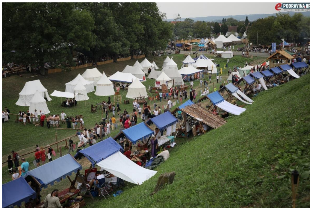
Slika 3.1.3. Prikaz Renesansnog festivala

Na primjeru ovogodišnjeg Renesansnog festivala, ukratko će se objasniti kako sve to izgleda. Dakle, festival traje četiri dana, odnosno od 22. do 25. kolovoza ove godine. Prvog dana festivala, u otvaranju manifestacije sudjelovale su samo koprivničke viteške skupine i obrtnici. Spomenuto je da festival svake godine ima određenu temu, a ove godine je tema bila tortura, odnosno prikaz korištenja sprava za mučenje. Prvog dana festivala nudile su se viteške interaktivne igre, renesansna modna revija, prikaz sprava za mučenje. Drugog i trećeg dana zatim je održan srednjovjekovni sajam te su se nudila srednjovjekovna jela, viteške igre, kao i prikaz sportova koji u sebi sadrže notu povijesti, odnosno prikaz kako je to nekad izgledalo. Posljednjeg dana festivala na rasporedu su bili uglavnom kulturno-umjetnički programi: predstave i glazbeni nastupi. Valja napomenuti da je ovaj prikaz veoma sažet te je program bogat i svakog dana nudi nove sadržaje vezane uz povijest. Dakle, kroz svaki se aspekt festivala nastoji dočarati kako je svakidašnji život izgledao u srednjem vijeku.