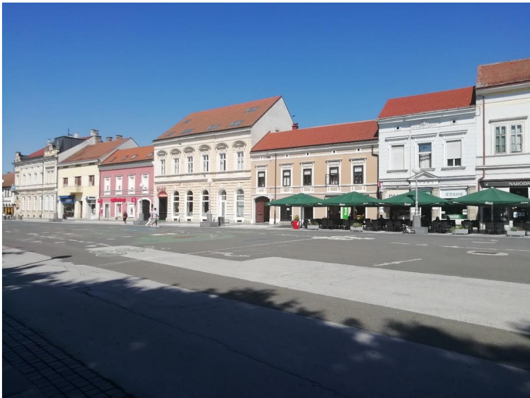
Slika 1.3. Zrinski trg

Osim Ulice Đure Ester koja je zadržala jedan niz povijesnih objekata, njoj se mogu pridružiti i Trg Bana Jelačića, Florijanski trg, Zrinski trg, Trg mladosti i Nemčićeva ulica.