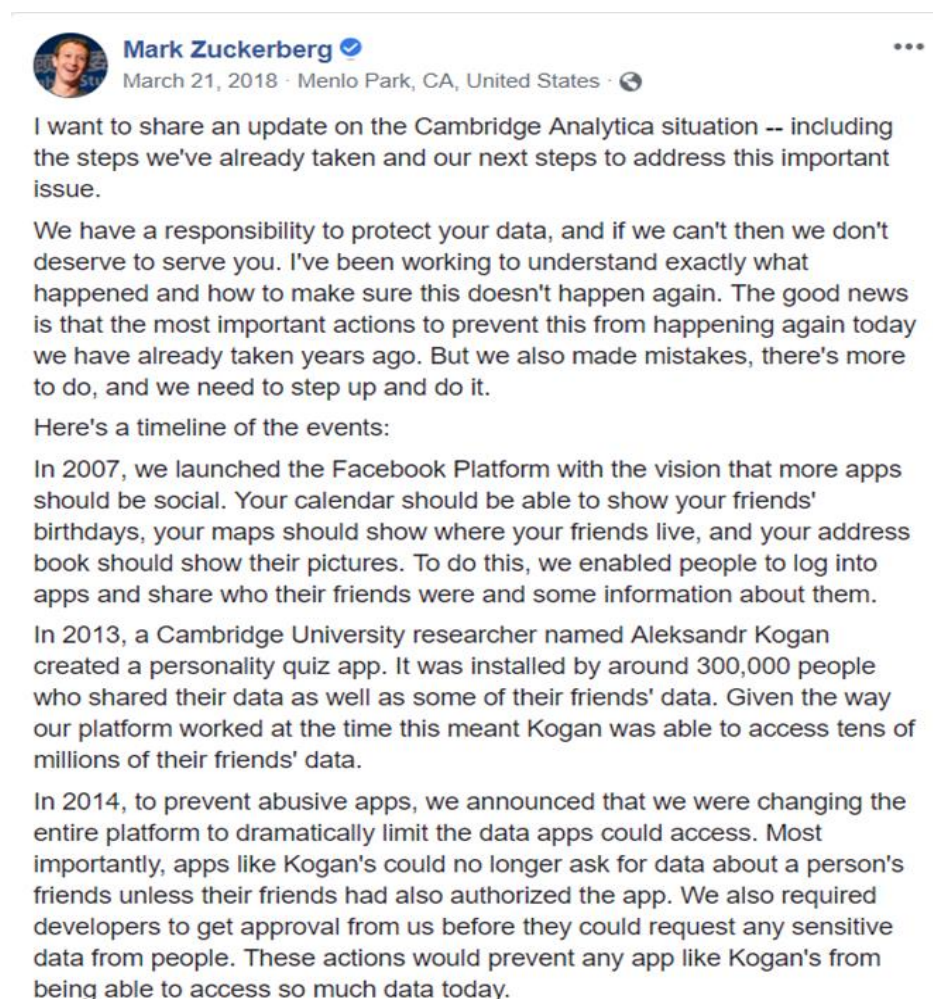
Slika 1: Originalni post Marka Zuckerberga na njegovo Facebook stranici