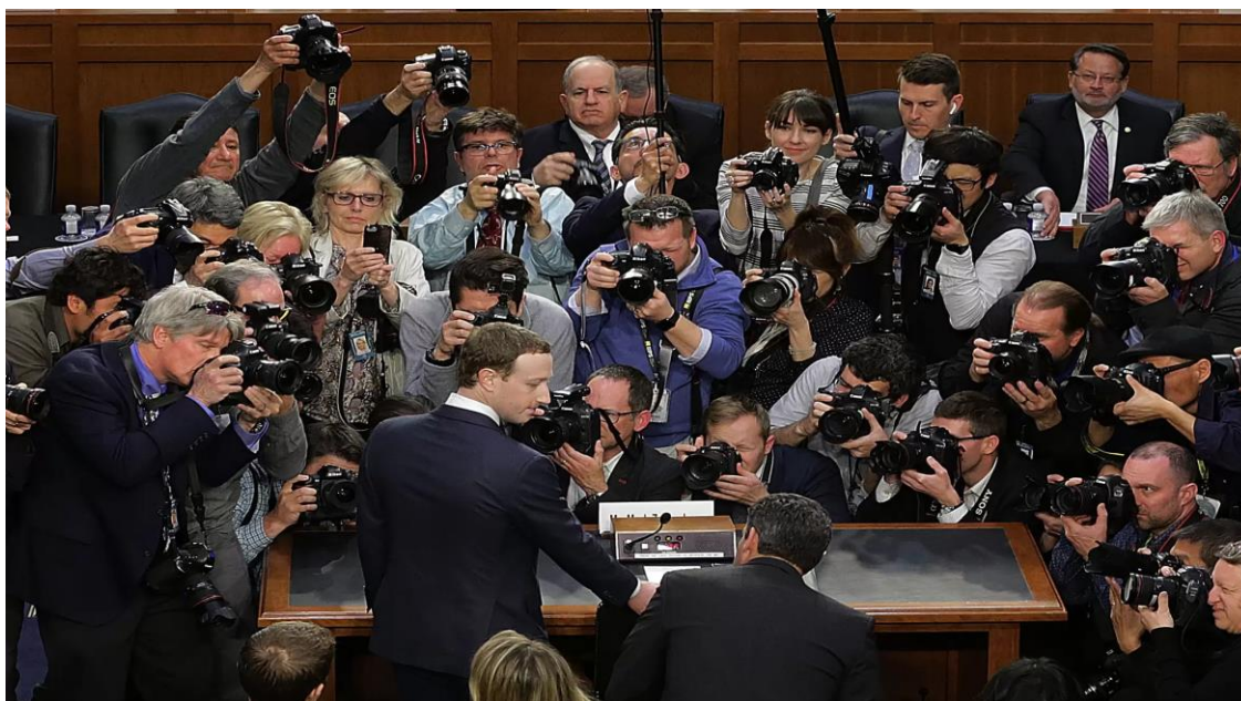
Slika 4: Mark Zuckerberg prije početka suđenja 10. svibnja 2018. u Američkom Kongresu