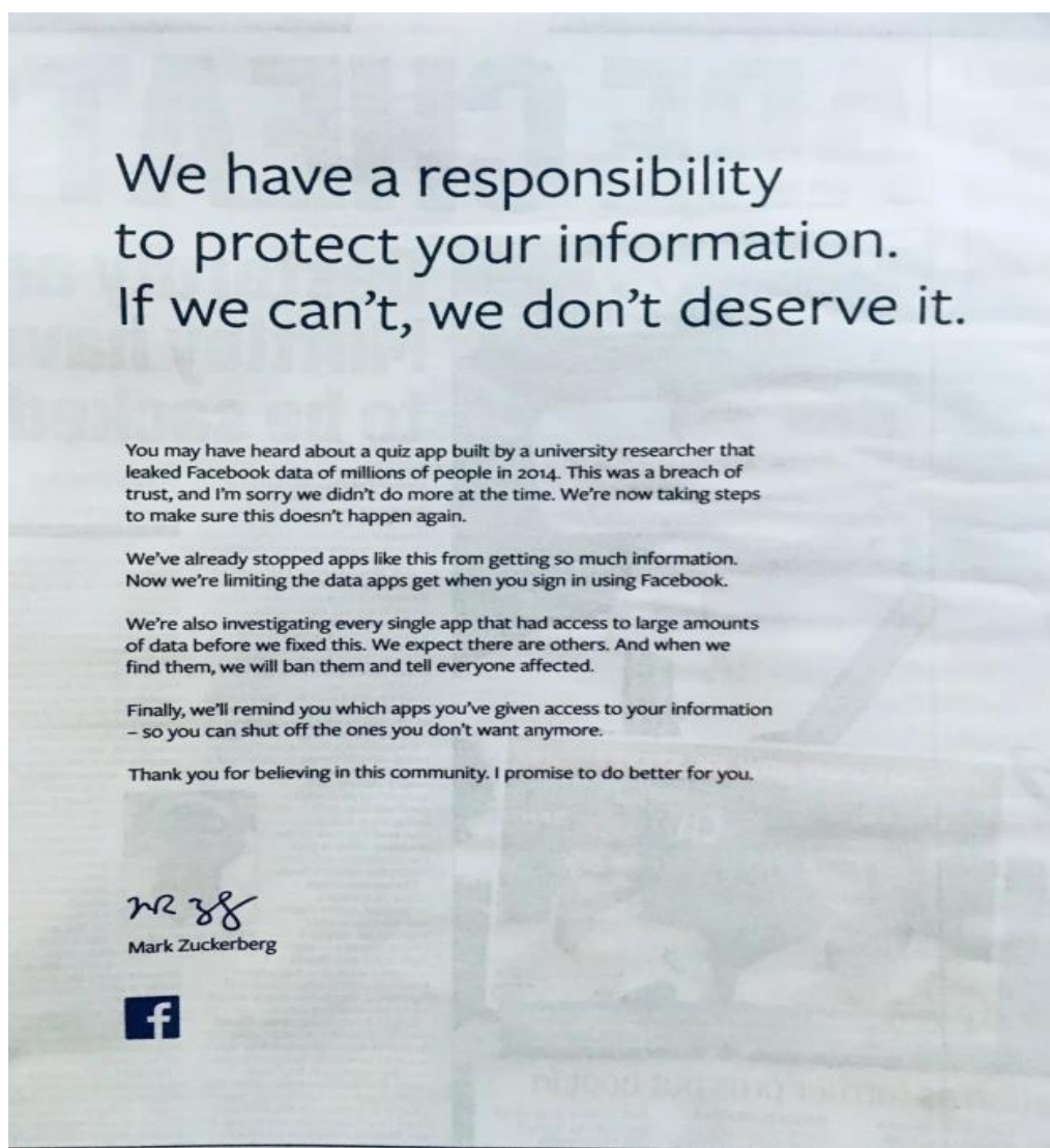
Slika 2: Oglas objavljen u novinama u SAD-u i Velikoj Britaniji na punim stranicama