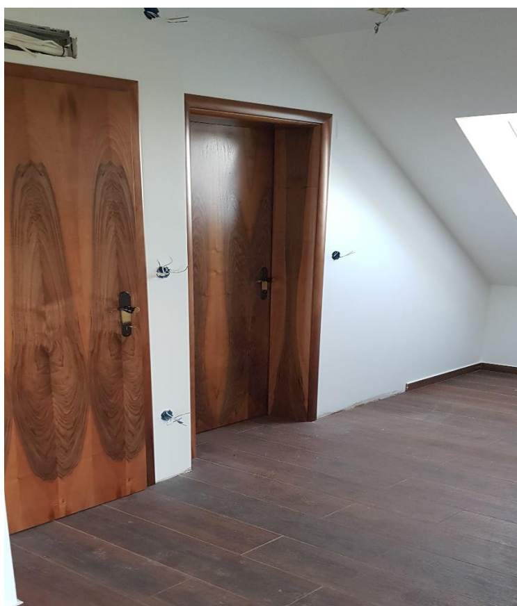
Slika 3. Unutrašnjost „Vile Dora“

Kuća za odmor „Vila Dora“ sastoji se od stambenog prostora sa: 1 sobom s bračnim krevetom u sklopu koje se nalazi LCD TV i ormar za pohranu, 1 kupaonice s tuš kabinom, wc-om, strojem za pranje rublja, kuhinje u sklopu koje se nalazi stol za 4 osobe, pećnica, mikrovalna, hladnjak, kuhalo, prostrana dnevna soba u sklopu koje se nalazi velika fotelja, LCD TV, stolom za blagovanje za 12 osoba i wc. Mogućnost 2 dodatna ležaja u dnevnoj sobi što bi povećalo maksimalni kapacitet kuće za 8 osoba i 2 kupaonice. U prizemlju kuće nalazi se ljetna kuhinja te natkrivena terasa sa velikim stolom za 8 osoba. U sklopu terase nalazi se pečenjara sa roštiljem i krušnom peći. U nastavku kuće nalazi se garaža i spremište. Dodatni bonus kući dati će jacuzzi, sauna, bazen i kamin kako bi se gosti mogli skroz opustiti.