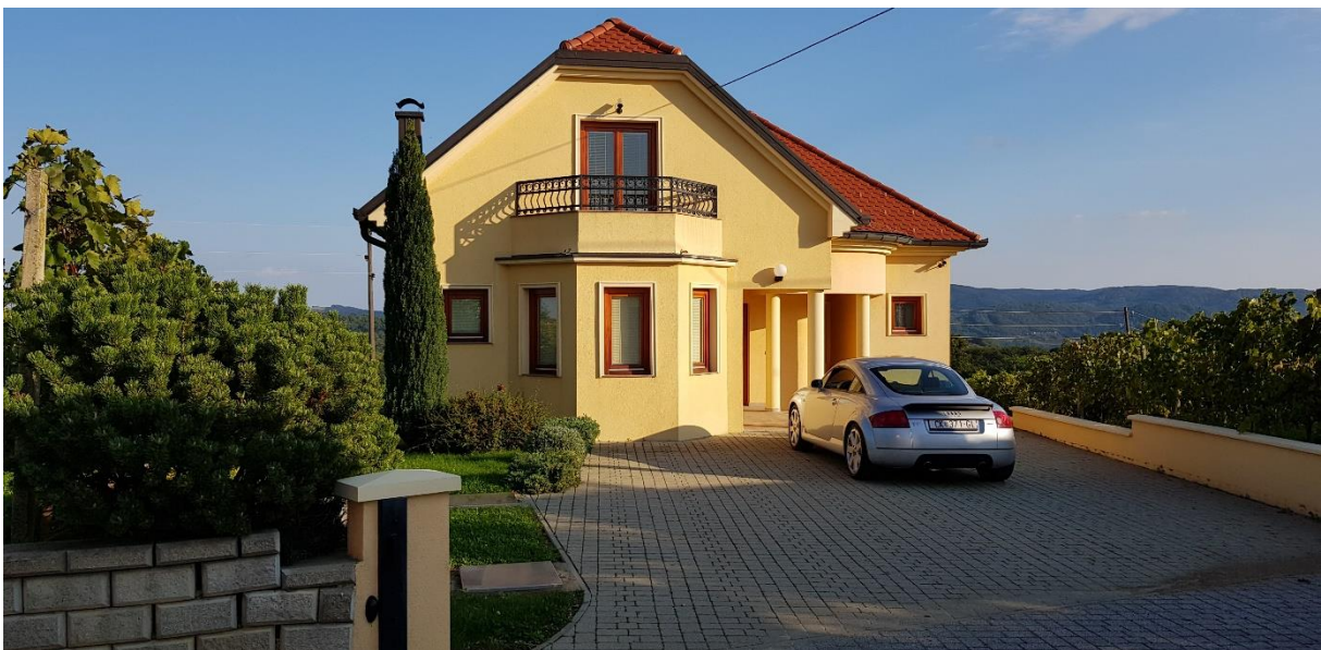
Slika 1. i 2. Izgled „Vile Dora“