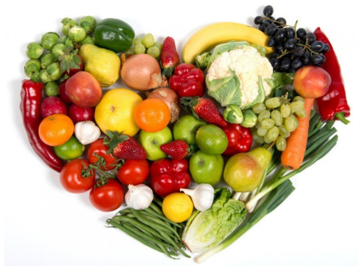
Slika 3.2. Voće i povrće

Podjela povrća prema dijelovima povrća koji se koriste za pripremanje jela: lisnato, cvjetasto, mahunasto, plodasto (rajčica, paprika, patliđan, krastavci, tikve), stabljičasto (šparoga, korabica), lukovičasto (luk, češnjak, poriluk, vlasac), korjenasto (mrkva, peršin, celer, rotkvica, repa, cikla, hren), gomoljasto (krumpir, slatki krumpir), gljive. Smatraju se energetske slabim izvorom jer kod njih je jako mali udio bjelančevina, masti i ugljikohidrata. Zbog toga je povrće vrlo dobro dijetnu prehranu. Uz djelovanje crijevne celuloze pojavljuje se plin koji pojača gibanje crijeva, a to ima za rezultat ubrzano prolaženje hrane kroz njih, što daje utječe na bolju probavu i smanjenu mogućnost pojave raka crijeva. Kod ljudi koji konzumiraju prehranu bogatiju celulozama rijetko se pojavljuje ovakva vrsta raka, dok sa druge strane dolazi do smanjenja apsorpcije masnoće i kolesterola u organizmu, pa isto tako celuloza štiti od pojave debljine i šećernih bolesti. [9]