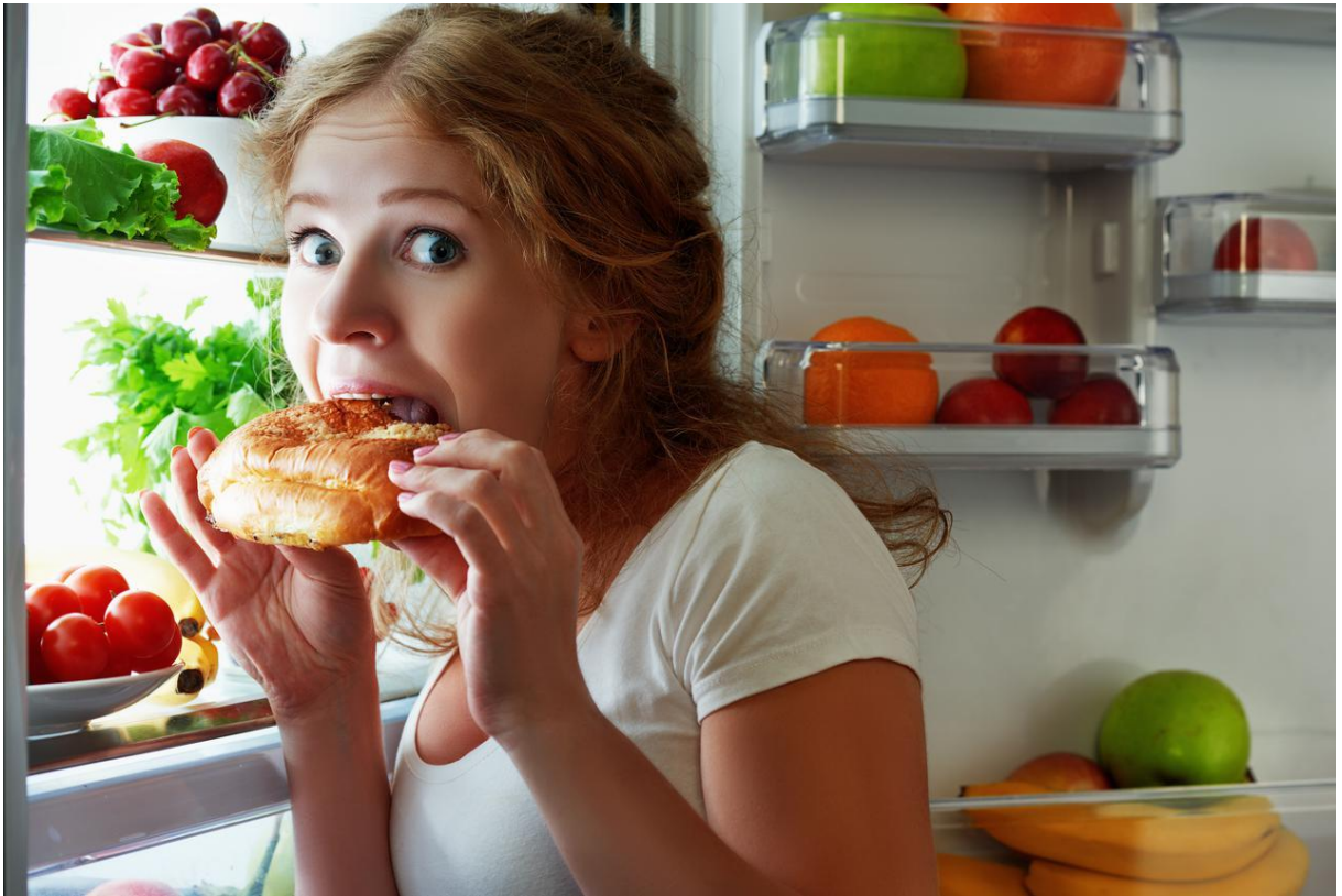
Slika 4. Ilustracija apetita