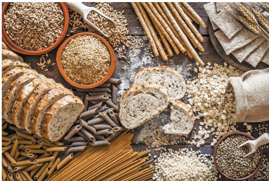
Slika 3.1. Žitarice