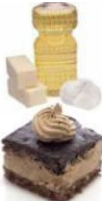
Slika 3.6. Masti i slatkiši

Linolna i linolenska kiselina smatraju se najznačajnijim esencijalnim masnim kiselinama. Omjer njih u majčinom mlijeku i u maslinovim uljima je skoro pa identičan. Uz davanje dodatne energije, takvo ulje daje pozitivan utjecaj na razvoj djeteta i dobro je za korištenje kao dodatak prehrani u dječjoj dobi. Kod starijih osoba vrlo je bitno da se uspori cerebralno starenje, kroz istraživanja koja su provedena došlo se do zaključka da je konzumacija ovakve vrste ulja u svakodnevnicu dovela do produljenog životnog vijeka ljudi koji su ga koristili. [17]