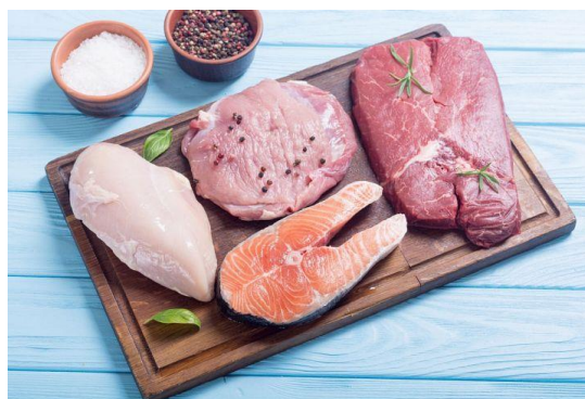
Slika 3.4. Meso i riba