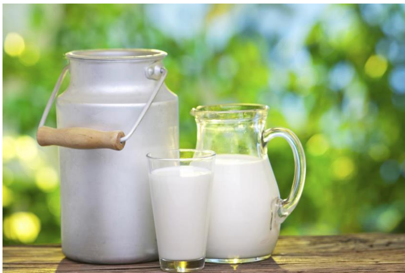
Slika 3.5. Mlijeko

Mlijeko od krava se dobiva tako da ih se muze otprilike 15-ak dana prije i 8-9 dana poslije što se otele, a takva pojava je proizvod stimulacije mliječne žlijezde; ostala mlijeka mogu biti ovčjeg, kozjeg i drugog podrijetla. Smatra se da mlijeko ima ulogu najpotpunije namirnice, pa se mala djeca u dobi dojenja mogu razvijati i rasti samo uz hranjenje mlijekom. Iako u sebi sadrži visoku razinu vode ono je namirnica koja je jako bogata i ima visoke energetske vrijednosti. U malim količinama nadopunjuje manje vrijednosti bioloških bjelančevina [10] Mlijeka koja u sebi sadrže otprilike 300-tinjak nutrijenata, imaju vrlo povoljan odnos prehrambene i zaštitne tvari uz visok udio vode, smatraju se hranom koja je prirodno savršena. [11] Mlijeko sadržava veće količine kalcija nego što se to može pronaći u bilo kojoj drugoj namirnici. Manjak kalcija smatra se velikim problemom za većinu stanovnika u svijetu, a to je posljedica manje konzumacije mlijeka i mliječnih proizvoda. Istraživanja pokazuju da ljudi u takvim zemljama gdje se manje konzumira mlijeko često i nižeg rasta nego ostali koji ga konzumiraju. Sadržanost nutrijenta kod mliječnog proizvoda se uvjetuje kemijskom sastavnicom sirovih mlijeka koja određuju i daljnje postupke u mljekarskim industrijama. [12]