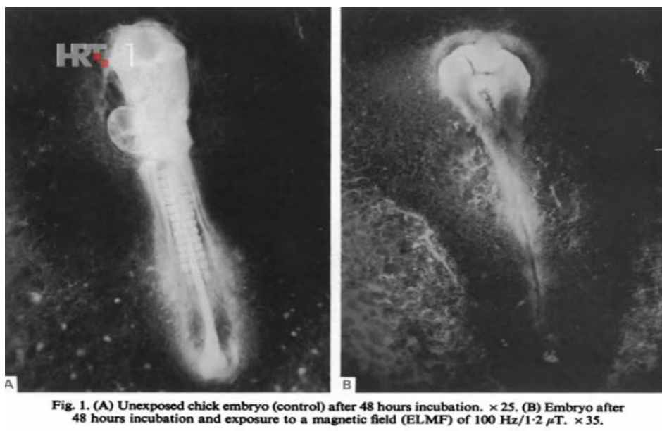
Slika 2: Dokazano je da se mozak prilagođava određenim frekvencijama, te da zračenje djeluje na deformitet embrija.