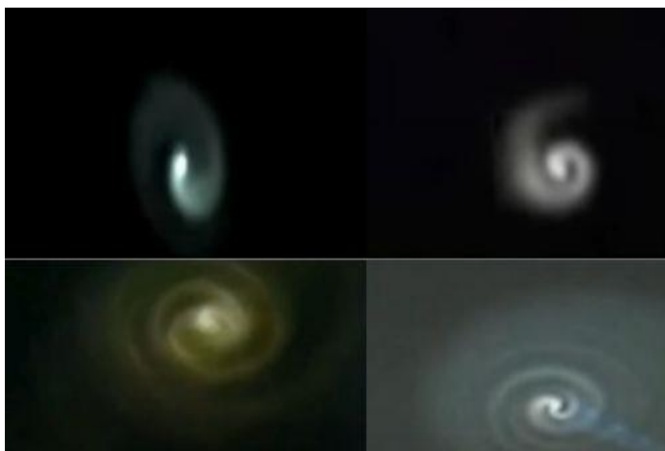
Slika 3: Plazma u atmosferi – lijevo gore: Australija 2010.god., desno gore: Rusija 2006.god, lijevo dolje: Kina 1988.god., desno dolje: Norveška 2010.god.