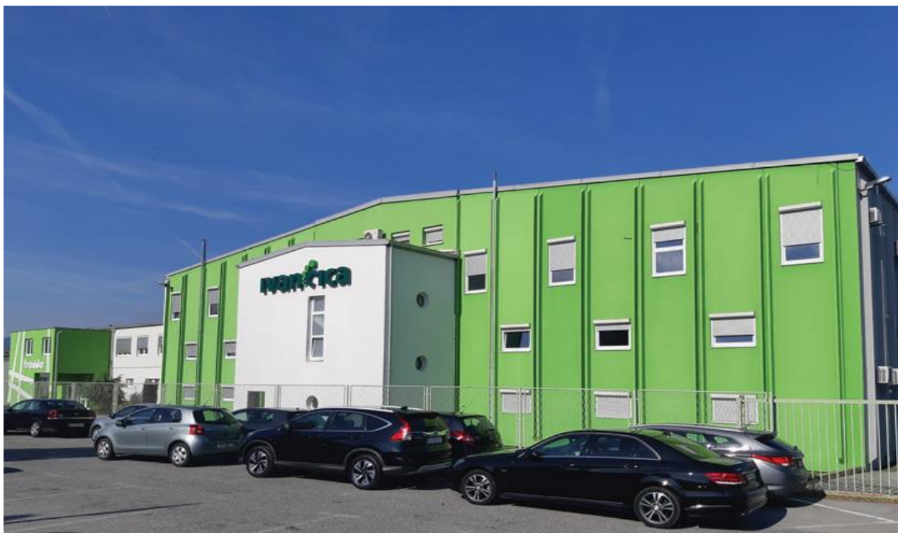
Slika 1. Tvornica Ivančica

Nagli razvoj počinje 1977. godine. Ivančica se seli na novu lokaciju, proširuju se kapaciteti, povećava se broj zaposlenih, provode se razne tadašnje samoupravne transformacije, prikazano na slici 1.