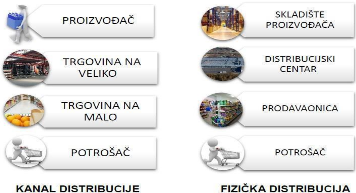
Slika 2. Fizička distribucija i kanal distribucije