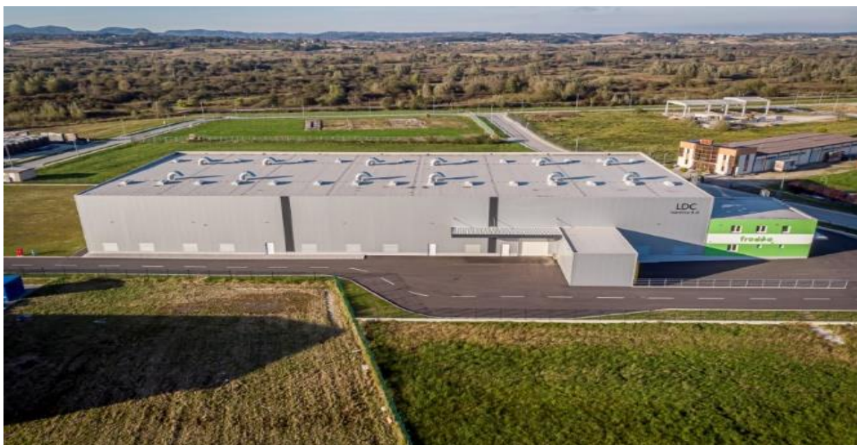
Slika 3. LDC Ivančica

Ranije spomenuti LDC-trenutno proteže se na ukupno 2962m 2 , zapošljava oko dvadesetak djelatnika, uključujući skladištare i operativno osoblje. Činjenica je da novoizgrađeni objekt tvrtke Ivančica d.d. izgrađen prema najnovijim standardima i pravilima struke, zaista mnogo znači za uspješno odvijanje cjelokupnog skladišnog procesa.