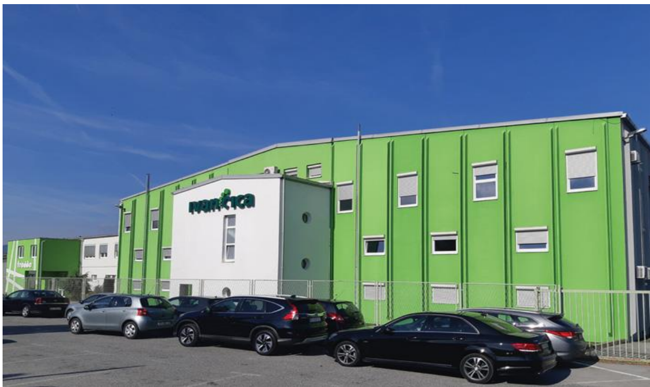
Slika 1. Tvornica Ivančica

Nagli razvoj počinje 1977. godine. Ivančica se seli na novu lokaciju, proširuju se kapaciteti, povećava se broj zaposlenih, provode se razne tadašnje samoupravne transformacije, prikazano na slici 1.