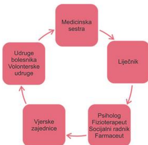
Slika 2.4. Interdisciplinarni pristup

Kvalitetna palijativna skrb može se jedino postići dobrom međusobnom suradnjom koja uključuje medicinsku sestru, volontere, liječnike, vjerske zajednice, tim psihologa, fizioterapeuta, socijalnog radnika i farmaceuta (slika 2.4.).