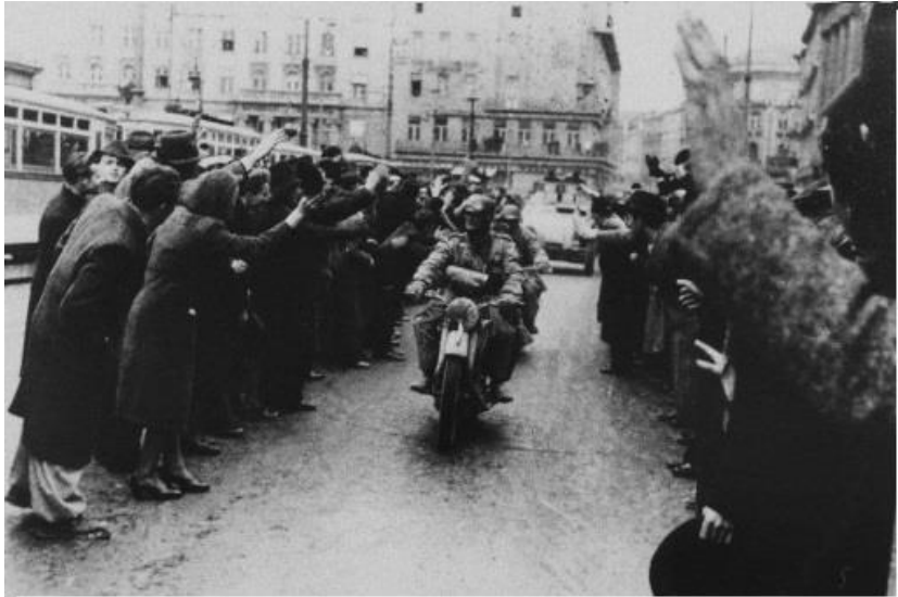
Slika 1.1. Ulazak Nijemaca u Zagreb 10. travnja 1941. godine, http://www.novolist.hr/var/novolist/storage/images/vijesti/hrvatska/smije-li-se-u-hrvatskoj-ulica-zvati-10.-travnja/3705710-2-cro-HR/Smije-li-se-u-Hrvatskoj-ulica-zvati-10.-travnja_ca_large.jpg , pristupljeno 21.09.2015.

Teritorijalno NDH je bila u posjedu čitave Bosne i Hercegovine, ali Italija je Rimskim ugovorom o razgraničenju između Italije i NDH dobila gotovo cijelu Dalmaciju, velike dijelove Hrvatskog primorja i dijelove Gorskog kotara. Italiji je prepuštena gotovo cijela hrvatska obala Jadrana, svi otoci osim Paga, Brača, Hvara i nekoliko manjih gradova i luka. Od važnijih lučkih gradova u NDH je ostao samo Dubrovnik. 11 Gubitak tako velikog dijela obale ipak nije bio dobro prihvaćen od velikog broja građana i to je bila jedna od prvih većih zamjerki na novu vlast.