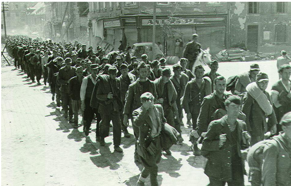
Slika 2.1. Križni put, http://kamenjar.com/wp-content/uploads/2015/04/bleiburg-kri%C5%BEni-put-kamenjar.jpg , pristupljeno 23. 09. 2015.

Prvih dana nakon dolaska partizanskih jedinica u Zagreb, preostale vlasti NDH zajedno s civilima krenuli su na dug i mukotrpan put prema Austriji gdje su se nadali predati Britancima od kojih su očekivali lakšu kaznu nego od partizana. Ostalim ustašama, domobranima i vojnicima put je bio naređen. Koloni se pridružio i velik broj njemačkih vojnika. Točan broj ljudi u koloni nije točno poznat (dijelom zbog tog što su komunističke vlasti šutjele o tom), a procjene idu do 130 000 ljudi. Oni koji su uspjeli doći do austrijskog Bleiburga nisu bili primljeni od strane britanske vojske zbog britanskog sporazuma s jugoslavenskim jedinicama o neprimanju izbjeglica. Jugoslavenske trupe su pomno isplanirale cijeli put i zarobljenici su bili samo u njihovim rukama. Partizani su zarobili i odveli u zatvore i logore na tisuće ljudi, a neki su pobijeni. Preživjeli su se raštrkali u svim smjerovima po čitavoj Jugoslaviji. Predviđa se da je ukupno tokom cijelog puta, te na njegovom završetku poginulo oko 30 i 40 tisuća domobrana i ustaša. 46