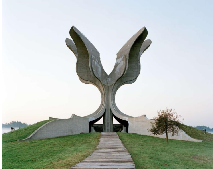
Slika 1.2. Spomenik u Jasenovcu u znak sjećanja na sve žrtve koje su stradale u njemu, http://www.hrt.hr/media/tt_news/jasenovac_06.jpg , pristupljeno 22. 09. 2015.