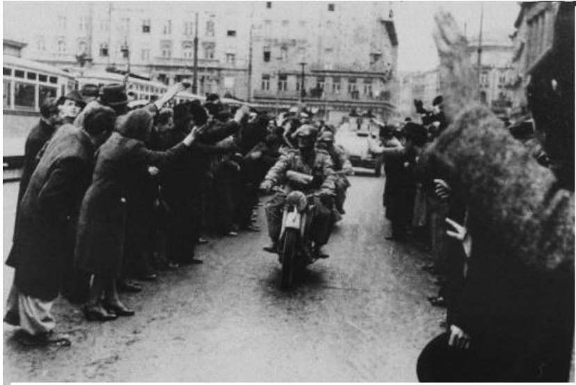
Slika 1.1. Ulazak Nijemaca u Zagreb 10. travnja 1941. godine, http://www.novolist.hr/var/novolist/storage/images/vijesti/hrvatska/smije-li-se-u-hrvatskoj-ulica-zvati-10.-travnja/3705710-2-cro-HR/Smije-li-se-u-Hrvatskoj-ulica-zvati-10.-travnja_ca_large.jpg , pristupljeno 21.09.2015.

Teritorijalno NDH je bila u posjedu čitave Bosne i Hercegovine, ali Italija je Rimskim ugovorom o razgraničenju između Italije i NDH dobila gotovo cijelu Dalmaciju, velike dijelove Hrvatskog primorja i dijelove Gorskog kotara. Italiji je prepuštena gotovo cijela hrvatska obala Jadrana, svi otoci osim Paga, Brača, Hvara i nekoliko manjih gradova i luka. Od važnijih lučkih gradova u NDH je ostao samo Dubrovnik. 11 Gubitak tako velikog dijela obale ipak nije bio dobro prihvaćen od velikog broja građana i to je bila jedna od prvih većih zamjerki na novu vlast.