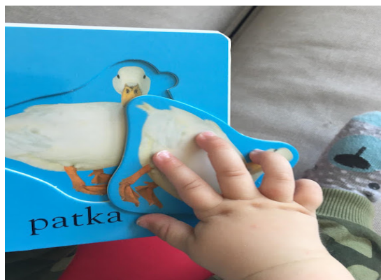
Slika 4. Primjeri taktilne aktivnosti u najranijoj dobi djeteta