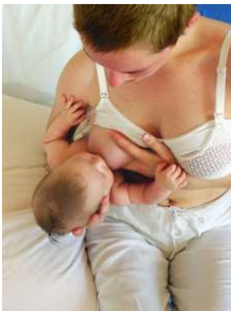
Slika 4.3.3 Položaj pod rukom ili položaj nogometne lopte

Položaj je dobio ovaj naziv jer podsjeća na igrače američkog nogometa koji pod rukama nose eliptičnu loptu. Položaj je prikazan na slici 4.3.3. U ovom položaju noge i tijelo dojenčeta nisu pripijeni uz majčino tijelo, nego su usmjereni sa strane majčinog tijela prema natrag. Glavica se dojenčetu pridržava dlanom, a gornji dio leđa se podupire prednjom rukom koja je poduprta jastucima. Ovaj položaj je drugačiji od položaja kolijevke. Donja čeljust dolazi na drugo mjesto u odnosu na položaj kolijevke, samim time je položaj prikladan za rasterećivanje ili izbjegavanje oštećenih bradavica [13].