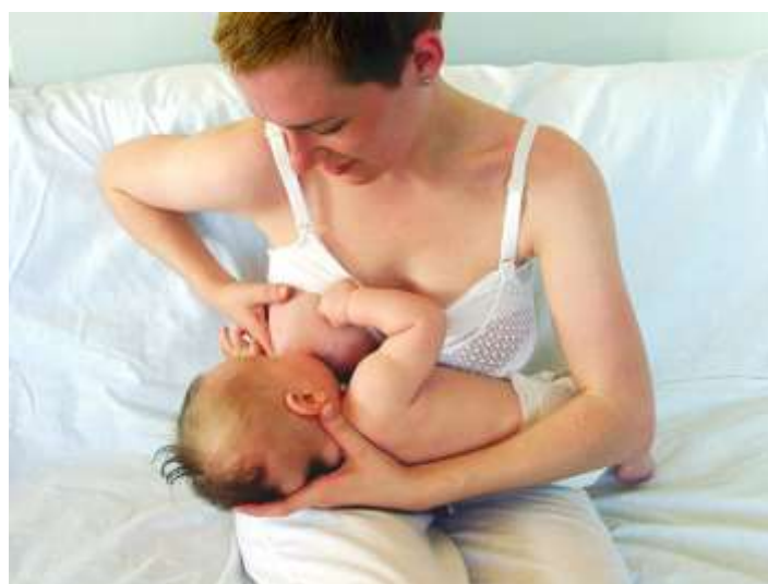
Slika 4.3.2 – Unakrsni hvat u položaju kolijevke

Unakrsni hvat u položaju kolijevke je hvat u kojem majka svojim dlanom podupire i vodi glavicu svoga djeteta, a podlakticom podupire njegova leđa. Položaj unakrsni hvat u položaju kolijevke je prikazan na slici 4.3.2. Navedeni položaj je preporučljiv za novorođenčad koja je rođena prerano, novorođenčad koja ima hipotonu mišićnu strukturu ili oslabljeni refleks sisanja [13].