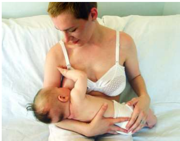
Slika 4.3.1 – Položaj kolijevke